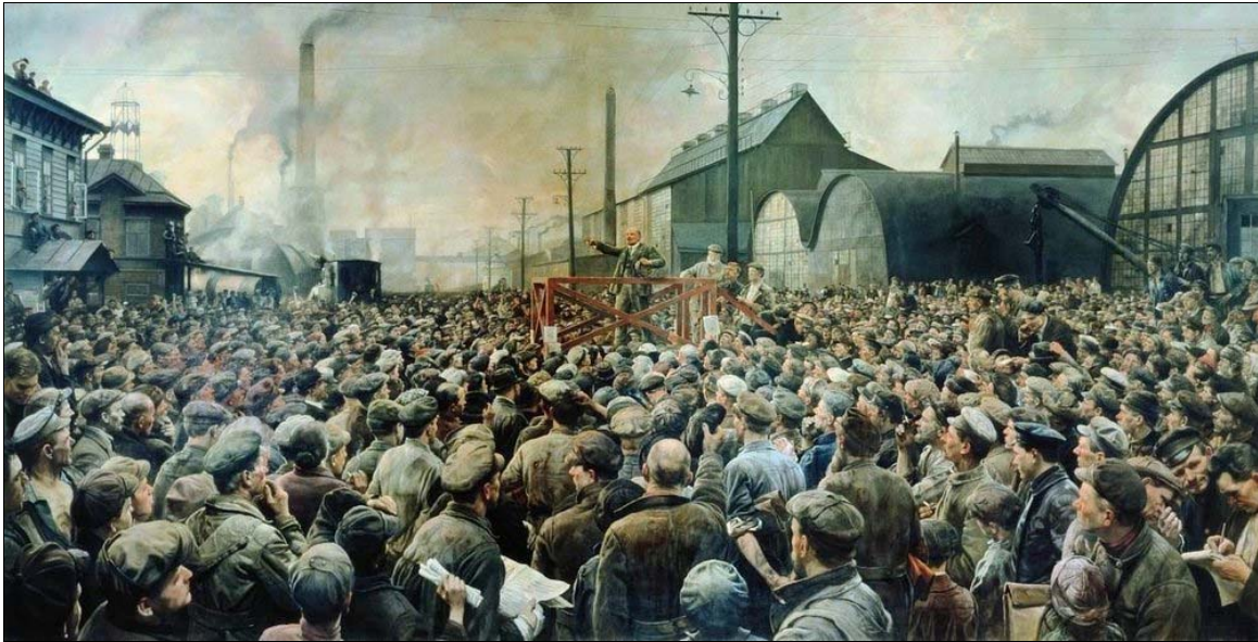
Lénine s'adresse aux travailleurs de l'usine de Putilov en mai 1917. (I. Brodsky, 1929)

La première considération idéologique de Lénine était la défense de la tendance marxiste, c'est-à-dire la tendance basée sur les conclusions du marxisme. Il présupposait que l'unité du mouvement repose sur la défense de cette tendance, c'est-à-dire sur le développement de la pensée marxiste et son élaboration en tenant compte des conditions de son temps. Entre autres, il a défendu la nécessité d'élaborer un plan pour bâtir le mouvement et il a condamné le concept spontanéiste de la « tactique-procès ». Les conclusions qu'il a tirées de son travail au début du XXe siècle ont aujourd'hui une profonde validité.