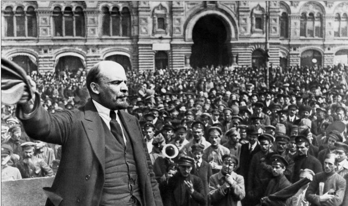
Lénine prononçant un discours sur la Place Rouge le 25 mai 1919

La conclusion de Lénine selon laquelle l'impérialisme est la veille de la révolution prolétarienne demeure toujours valide aujourd'hui. Ce concept est un autre point de lutte idéologique, et sa défense et son élaboration sont à l'ordre du jour. C'est une chose que de décrire la progression de la décadence de l'impérialisme, c'en est une autre que de développer le front prolétarien et d'offrir une alternative pour que le Nouveau puisse surmonter la résistance de l'Ancien et le vaincre.