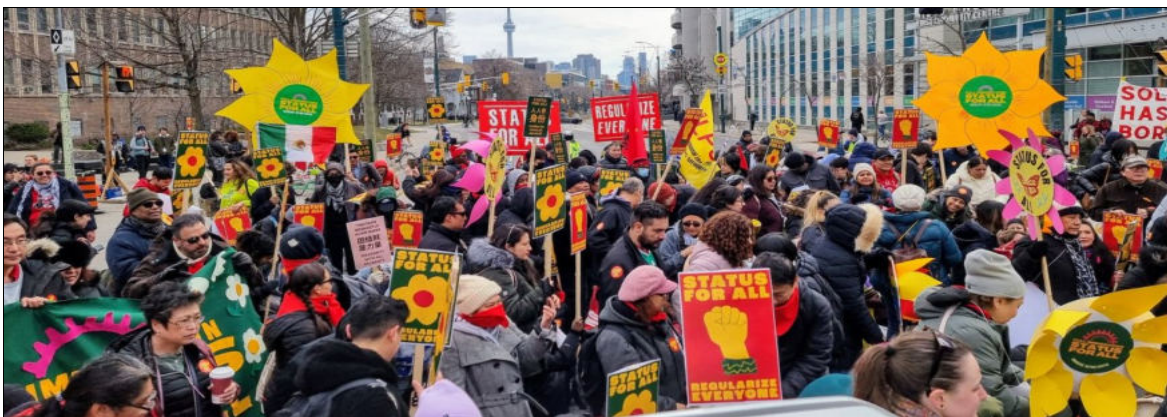
Toronto, 16 mars 2024

Les 16 et 17 mars, d'un océan à l'autre, des travailleurs ont organisé des actions militantes dans huit villes pour affirmer les droits de toutes et de tous et exiger du gouvernement fédéral qu'il respecte son engagement de régulariser le statut de toutes les personnes sans papiers qui remplissent une condition de résidence de base, en leur accordant le statut de résident permanent. Ces actions ont été lancées par le Réseau des droits des migrants dans le cadre du Printemps des migrants, une série de manifestations, d'activités éducatives et d'actions qui se dérouleront avant l'été.