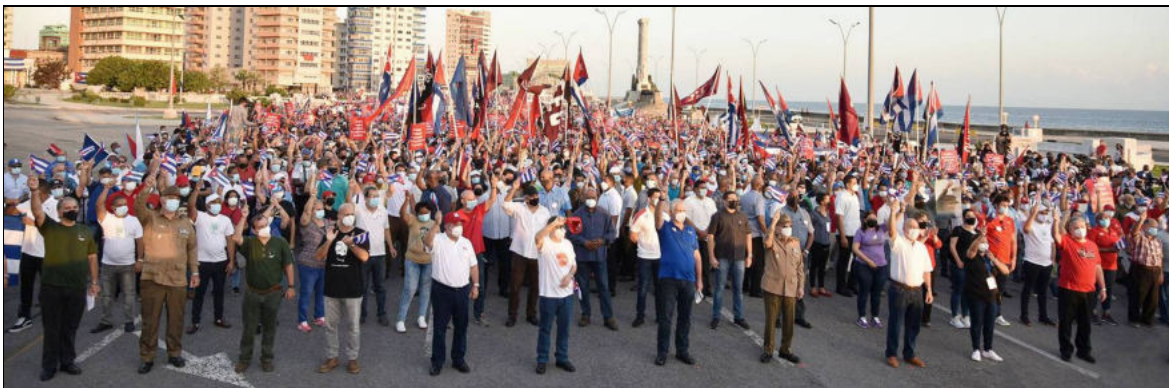
Cuba répond par un grand rassemblement pour la défense de la révolution, à La Havane, 17 juillet 2021, à une précédente tentative de renversement de la Révolution.

Le Parti communiste du Canada (marxiste-léniniste) salue l'héroïsme du peuple cubain et de son gouvernement qui ont une fois de plus déjoué les tentatives des États-Unis et de leurs agents contre-révolutionnaires de provoquer un soulèvement populaire contre la Révolution. Les demandes d'un approvisionnement stable en électricité et en nourriture amènent des problèmes que le gouvernement s'efforce de résoudre malgré le blocus et les sanctions brutales des États-Unis. Ce n'est pas la Révolution qui est à l'origine de ces problèmes, c'est le blocus américain auquel tous les pays membres des Nations unies, à l'exception des États-Unis, d'Israël et d'un ou deux protectorats américains, exigent qu'on mette fin. Ces manifestations ont été provoquées par des agences américaines contre-révolutionnaires qui n'ont aucunement l'intention de leur apporter des solutions. Le plus remarquable est l'attention immédiate accordée par les fonctionnaires des gouvernements