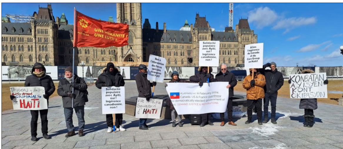
Rassemblement à Ottawa lors du 20e anniversaire du coup d'État en Haïti, 29 février 2024

L'affirmation des États-Unis, du Canada, de la France et d'autres pays que les « gangs criminels » sont le problème en Haïti est une tentative pitoyable de détourner l'attention des sales magouilles du groupe restreint appelé Core Group établi par la résolution S/RES/1542 (2004) du Conseil de sécurité de l'ONU à l'instigation des États-Unis. Le soi-disant Core Group est présidé par le Représentant spécial de l'ONU en Haïti et comprend également des représentants du Brésil, du Canada, de la France, de l'Allemagne, de l'Espagne, de l'Union européenne, des États-Unis et de l'Organisation des États américains. C'est le vrai « gang criminel » qui opère en Haïti.