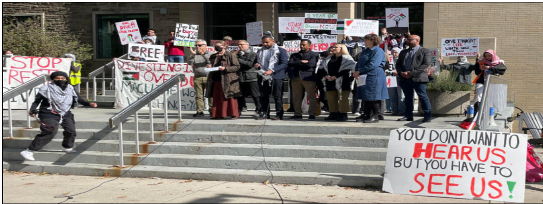
Université McMaster, 12 octobre