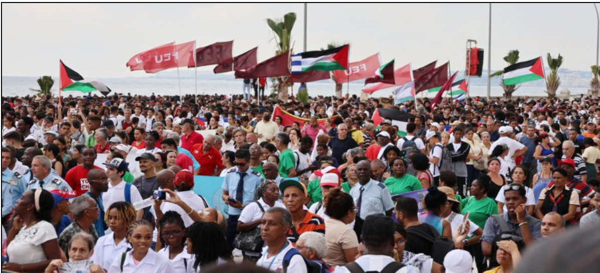
14 octobre, marche de solidarité avec la Palestine