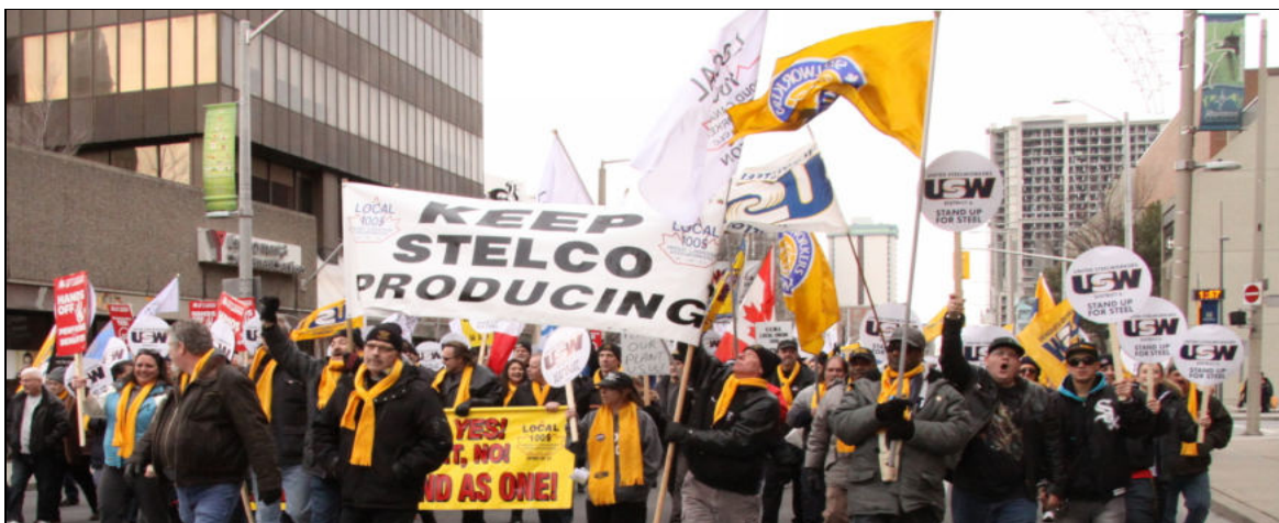
Journée d'action des Métallos de Hamilton, le 30 janvier 2016, lors de la lutte contre la deuxième série de fraudes de faillite