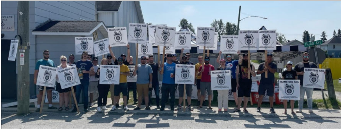
Piquet d'information à Hornepayne, 29 août 2024