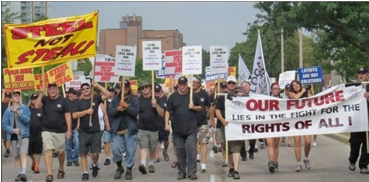
Journée d'action de la section locale 1005 des Métallos à Hamilton, Fête du travail 2014