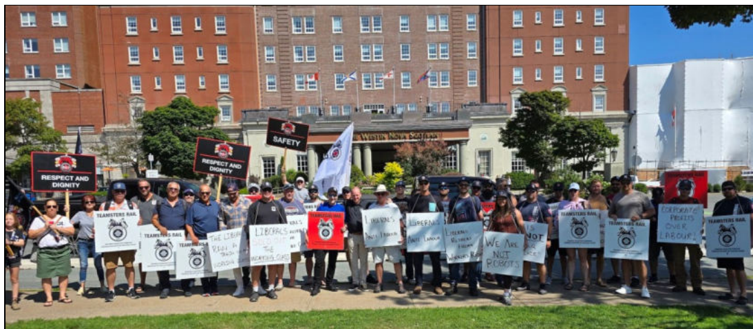
Les cheminots font du piquetage devant la retraite du cabinet libéral à Halifax, le 27 août 2024.