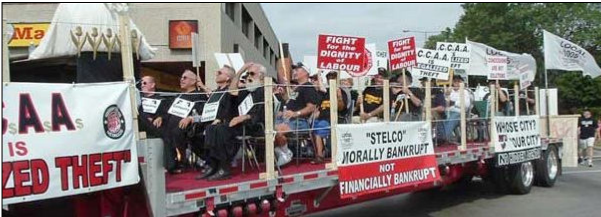
Le contingent de la section locale 1005 des Métallos dans le défilé de la Fête du travail à Hamilton, le 6 septembre 2004, lors de la première phase de la lutte contre la fraude à la faillite de la LACC.