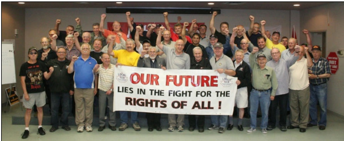
Célébration du 10ème anniversaire de la première réunion du jeudi, 13 juillet 2013. Les réunions sont l'occasion pour les travailleurs de discuter de leurs préoccupations et de s'informer sur les importants développements économiques et politiques et comment intervenir.