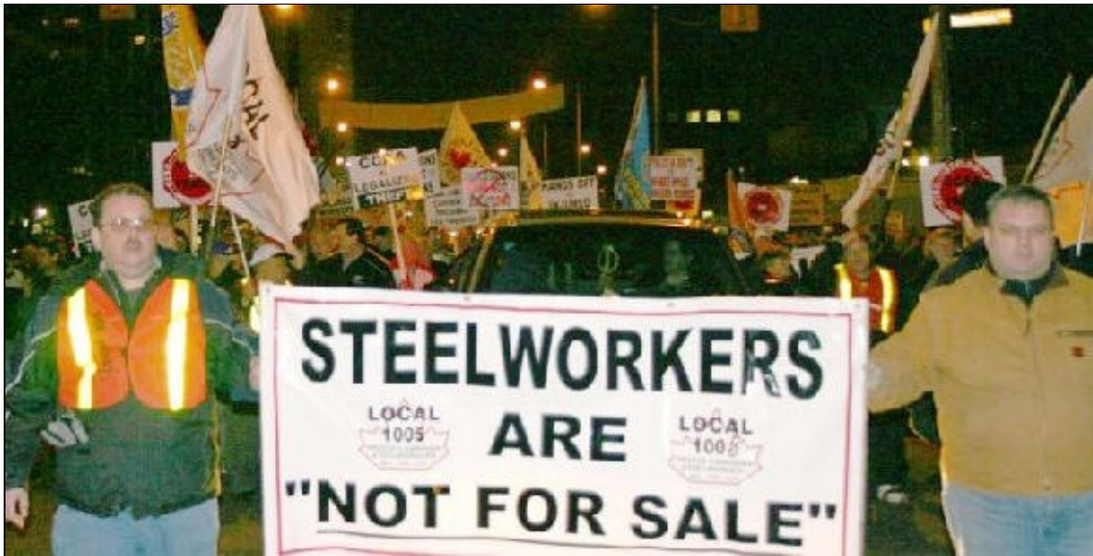
Marche des métallos de la section locale 1005 du syndicat des Métallos à Hamilton 27 février 2004