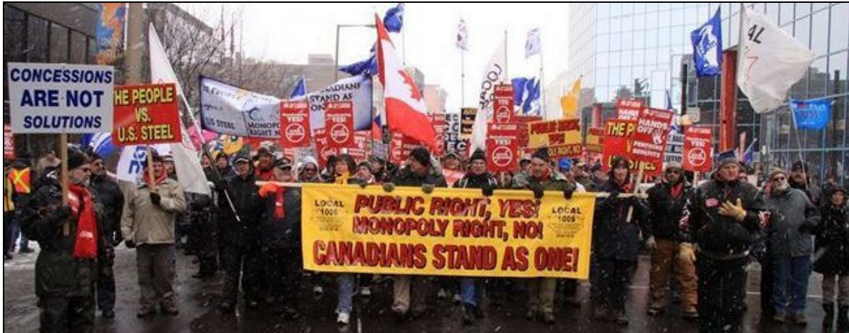
Journée d'action, le 29 janvier 2011, « Le peuple contre US Steel » pendant un lockout de 11 mois par US Steel pour tenter d'imposer des concessions aux travailleurs.