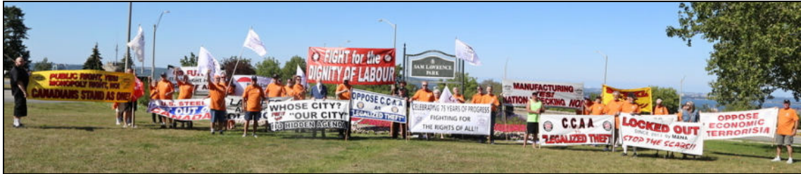
La section locale 1005 des Métallos célèbre les 75 ans de sa fondation lors de la Fête du travail de 2021