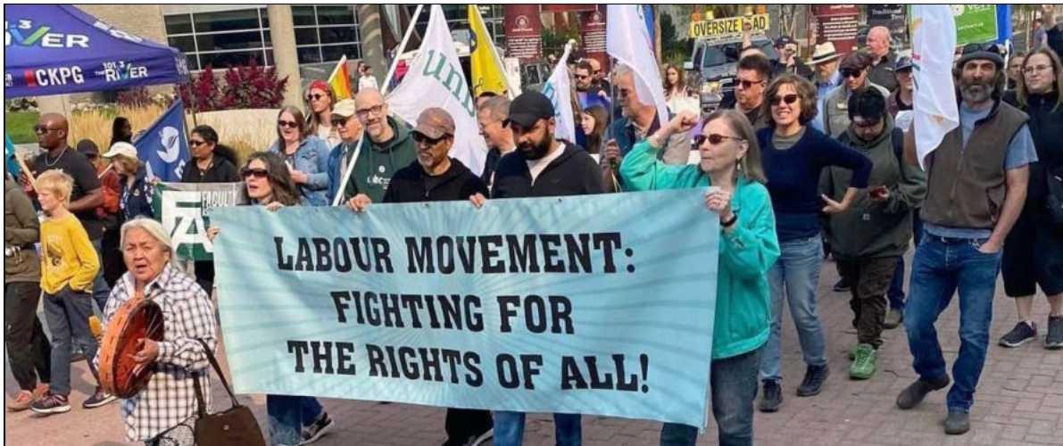
La Fête du travail à Prince George en 2023

En cette occasion, le Centre ouvrier du Parti communiste du Canada (marxiste-léniniste) envoie ses salutations à tous les travailleurs et travailleuses d'un océan à l'autre. Il transmet ses meilleurs vœux de succès aux travailleurs et travailleuses de tous les secteurs de l'économie dans leurs efforts pour garantir les droits de tous et toutes. Ces batailles sont menées dans les conditions difficiles de l'offensive antisociale qui dure depuis des décennies et dans laquelle des crimes de toutes sortes sont commis au nom de l'économie et de la démocratie.