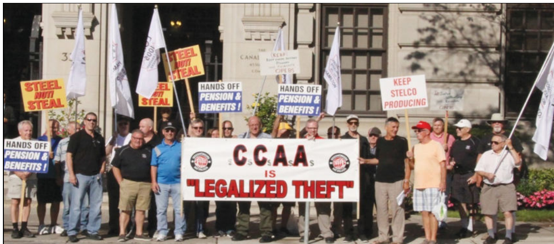
Deuxième ronde de la section locale 1005 des Métallos contre la fraude de se placer à l'abri des créanciers, 27 juillet 2026