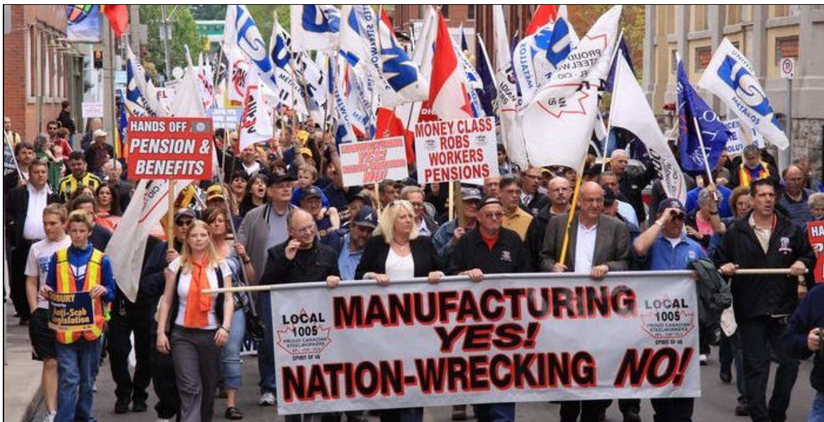
Premier Mai 2010, manifestation et conférence sur l'édification nationale organisées à Hamilton par la section locale 1005 des Métallos