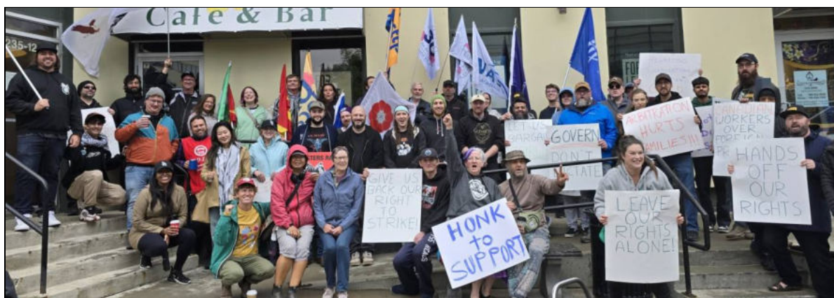
Piquetage en appui aux travailleurs ferroviaires au bureau du député Randy Boissonnault à Edmonton, 29 août 2024

Chaque jour, plus d'un milliard de dollars de marchandises sont transportées par rail au Canada. Il s'agit d'un secteur très important de l'économie, mais les barons du rail ne s'intéressent qu'à l'argent qu'ils font et pas du tout au bien-être des Canadiens ou des Américains, dont ils traversent également le territoire.