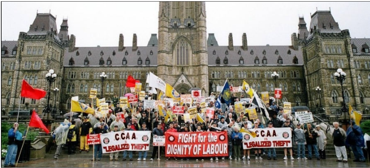
Rassemblement des Métallos de Hamilton à Ottawa, le 26 septembre 2005, une action parmi d'autres dans leur lutte contre la fraude de se placer à l'abri des créanciers