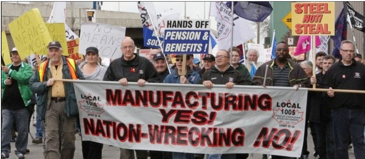
Hamilton, le 1er mai 2012

L'un des signes, parmi trop d'autres, que les gouvernements du Canada et de l'Ontario se fichent éperdument de l'économie canadienne est leur attitude à l'égard de la production d'acier au Canada.