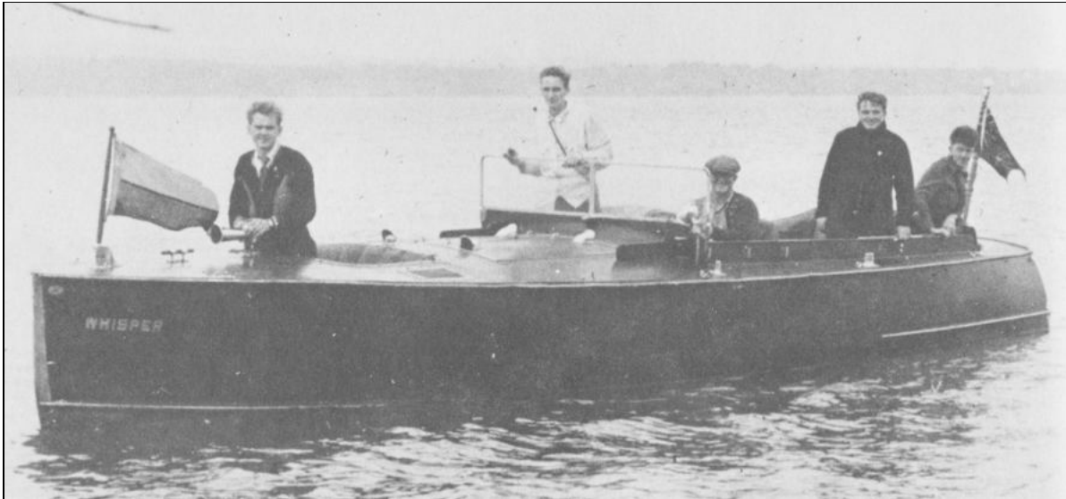
Les métallos font le piquet devant Stelco lors de la grève historique de 1946.