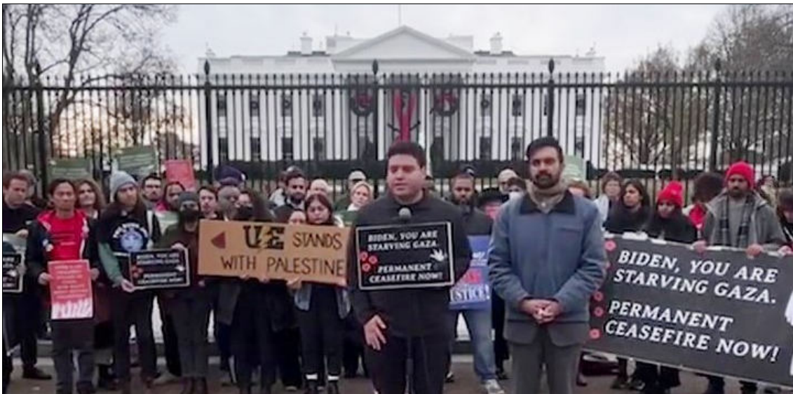
Les Travailleurs unis de l'automobile américains prennent position en faveur d'un cessez-le-feu à Gaza, 1er décembre 2023.

Un autre exemple de la fraude des primaires est le fait que l'appui des Travailleurs unis de l'automobile (UAW) à Biden est promu comme étant une « grande victoire ». Biden tente d'obtenir l'appui des syndicats face à l'opposition massive qu'ils expriment sur la question du génocide en Palestine et leur revendication d'un cessez-le-feu immédiatement. Les UAW sont l'un des plus importants syndicats à adopter une telle résolution. Plus récemment, un autre syndicat d'importance, le Syndicat international des employés de service (SEIU), avec deux millions de membres, a aussi adopté cette revendication. Le UAW, les Travailleurs de l'électricité unis (UE) et le Syndicat des travailleurs des postes (APWU) ont fait circuler une résolution et plus de 4 500 syndicats locaux partout au pays appuient les revendications appelant à un cessez-le-feu, à l'aide humanitaire immédiate et à la reconnaissance des droits à Gaza et de mettre fin au siège. Le nombre de syndicats et d'autres organisations adoptant des résolutions exigeant un cessez-le-feu augmente sans cesse.