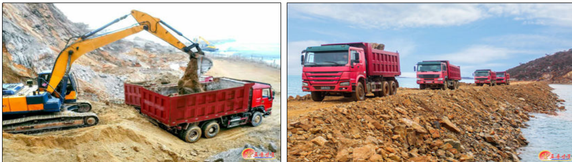
Projets de poldérisation

La réalisation de ces objectifs d'édification nationale dans l'économie est d'autant plus admirable que la RPDC a dû faire face à des décennies de sanctions économiques injustes et brutales conçues par les États-Unis pour provoquer un changement de régime et imposer un système libéral-démocratique dans lequel les oligarques étrangers peuvent piller la nation à souhait. Le peuple de la RPDC a choisi son système et, en tant qu'architecte de son propre avenir, montre qu'un peuple qui a pris son destin en main et le défend contre vents et marées peut accomplir des miracles.