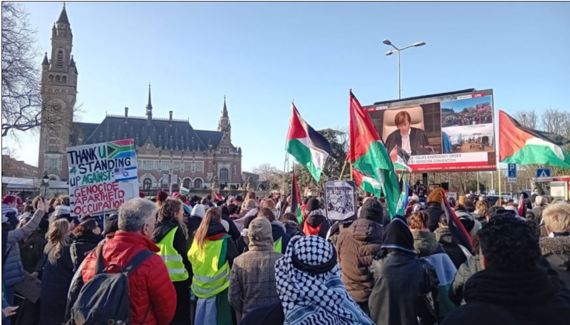
Rassemblement devant le Palais de la paix de La Haye pour entendre la décision provisoire de la Cour internationale de justice, 26 janvier 2024

De l'avis du Parti communiste du Canada (marxiste-léniniste), il est important de discuter de la signification des délibérations de la Cour internationale de justice (CIJ) sur le génocide israélien. Les Sud-Africains ont rassemblé 84 pages de documentation et d'arguments fondés sur l'état de droit international, tandis qu'Israël a nié commettre un génocide ou avoir l'intention de le faire. Les États-Unis, le Royaume-Uni et d'autres anciennes puissances coloniales, ainsi que des dominions comme le Canada, se sont rangés à l'avis d'Israël.