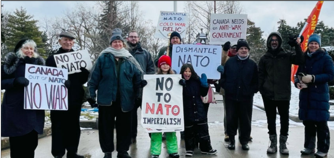
Piquetage à Windsor à l'occasion du premier anniversaire de la guerre par procuration des États-Unis/OTAN en Ukraine, le 25 février 2023

coalition et le Canada en assurerait la coprésidence avec l'Ukraine. Le communiqué de presse d'Affaires mondiales Canada précise : « En tant que coprésident, le Canada travaillera en étroite collaboration avec l'Ukraine pour organiser la Coalition, soutenir le dialogue, et l'échange d'informations et pour coordonner les messages clés entre les principales parties prenantes. Nous mettrons l'accent sur l'amplification des nombreux efforts existants et le partage des enseignements tirés, en particulier ceux qui ont abouti au retour des enfants. » Il poursuit en affirmant que le Canada « offrira une expertise pratique grâce aux représentantes et représentants canadiens disposés à aider leurs homologues ukrainiens advenant que ceux-ci aient besoin d'une expertise technique ou de ressources ».