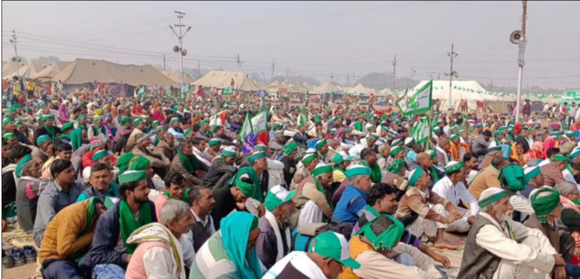
Convention nationale de la Bhartiya Kisan Union, 29 janvier 2024, à Prayagraj dans l'Uttar Pradesh.

Lors de la convention nationale de la Bhartiya Kisan Union (Union des agriculteurs indiens) qui s'est tenue en janvier à Prayagraj, dans l'Uttar Pradesh, les agriculteurs ont décidé d'intensifier leur lutte pour obtenir le prix minimum de soutien (MSP) pour leurs récoltes. Ils réclament le prix de revient majoré de 50 %, comme le propose le rapport 2018 de la Commission nationale Swaminathan sur les agriculteurs. Un communiqué de presse de la convention rapporte que Chaudhary Rakesh Tikait, porte-parole national de l'Indian Farmers' Union, s'adressant au panchayat (sorte d'assemblée) le dernier jour, a déclaré que le prix de la canne à sucre qui venait d'être annoncé par le gouvernement de l'Uttar Pradesh ce jour-là n'était pas suffisant. Les agriculteurs s'attendaient à une augmentation plus importante, car les dépenses agricoles augmentent chaque jour. Les agriculteurs n'obtiennent pas un prix raisonnable pour leurs récoltes par rapport au coût de production. Il a déclaré : « Renforçons tous ensemble l'unité villageoise de notre district. Le travail de l'unité des jeunes dans l'organisation n'est pas de donner des mémorandums pour les problèmes; elle devrait travailler avec les officiers supérieurs. »