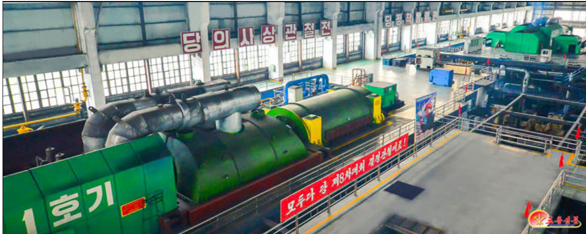
La centrale thermique

Le rapport du 9e plénum note que les 12 objectifs de développement économique national ont tous été atteints pour l'année, notamment 103 % de la production de céréales, 102 % de l'acier laminé, 131 % des métaux ferreux, 105 % des produits de la mer et 109 % de la construction de logements, entre autres secteurs. Il a également été noté que, par rapport à 2020, année où la pandémie de la COVID 19 s'est déclarée au niveau mondial, la production d'acier laminé a été multipliée par 1,9, celle de machines-outils par 5,1, celle de ciment par 1,4 et celle d'engrais par 1,3. On note que le PIB a été multiplié par 1,4 par rapport à 2020.