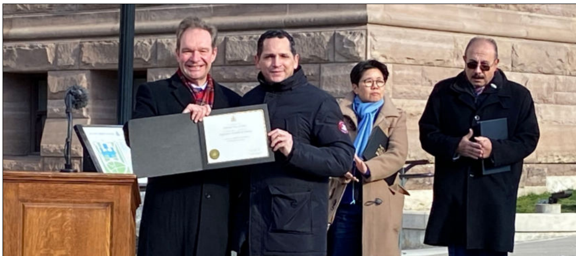
Le consul général de la République de Cuba, Yanier Castellanos Orta (à droite), reçoit une citation du président de l'assemblée législative de l'Ontario, Ted Arnott (à gauche), à l'occasion du 65e anniversaire de la révolution cubaine.

président de l'Assemblée législative de l'Ontario, Ted Arnott, deux députés provinciaux et des membres du corps diplomatique de plusieurs pays, ainsi que des Cubains résidant à Toronto et des amis et sympathisants de Cuba.