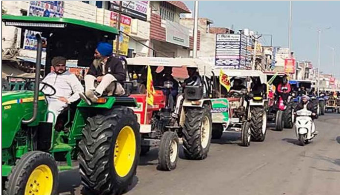
Défilé de tracteurs, 26 janvier 2024, Sangrur, Inde

La terreur de l'État indien ne les a pas découragés. Les entreprises qui contrôlent l'État indien sont prêtes à tout pour voler les terres des agriculteurs afin de maximiser leurs profits. Un officier de l'armée à la retraite a déclaré que la situation était pire qu'à la frontière entre l'Inde et le Pakistan. Ce que les entreprises et leurs États ont fait dans le Nord-Est, dans le Chhatisgarh, le Jharkhand et d'autres régions tribales, les agriculteurs indiens le subissent à présent. Afin de voler leurs terres, le gouvernement les attaque brutalement. Ce qui s'est fait à la périphérie pendant des décennies a été porté au centre, révélant l'essence même de la démocratie libérale : le vol des terres, le génocide et la répression au service des entreprises.