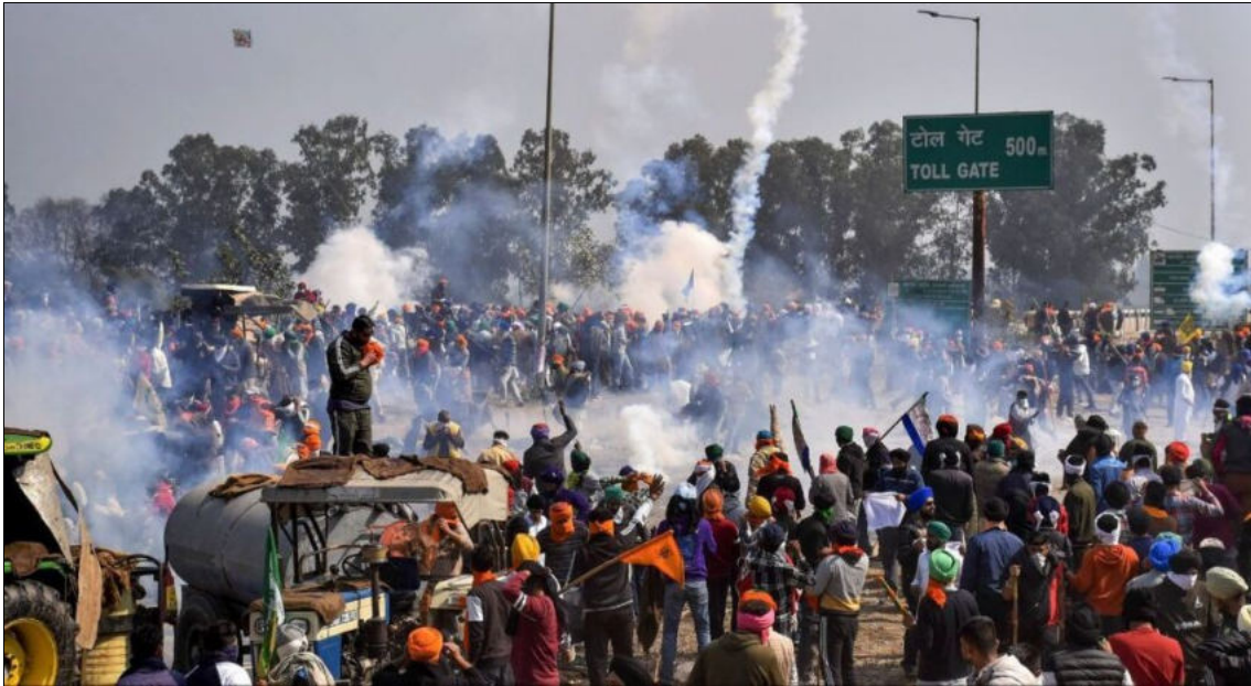
Manifestation d'agriculteurs près de la frontière de Delhi face à la terreur d'État, 16 février 2024

Les protestations des agriculteurs se sont heurtées à la terreur de l'État. Le 16 février, de nombreux dirigeants agricoles ont été arrêtés et placés en détention. Les agriculteurs ont été arrêtés sur les routes, barricadés, visés par des tirs et attaqués. Mais ils sont très innovants. Un agriculteur a passé cinq heures avec un kit/enrouleur d'environ 5 dollars à poursuivre un drone de 6 000 dollars larguant des grenades lacrymogènes sur les manifestants jusqu'à ce qu'il parvienne à l'abattre.