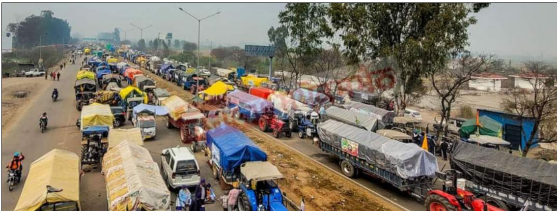
Les agriculteurs bloquent les autoroutes près de la frontière de Shandhu, 18 février 2024.

La Bharatiya Kisan Union a tenu son panchayat mensuel à Sisauli, Muzzafarnagar, le 17 février. Le 18 février, le SKM s'est réuni pour planifier sa stratégie. Le gouvernement central a également organisé une réunion avec les agriculteurs au même moment, mais les réunions organisées par le gouvernement sont considérées comme des tentatives de tromper les agriculteurs et les populations et de prolonger leur misère. Au cours des 50 dernières années, les gouvernements ont formé de nombreux comités, mais les agriculteurs ont été paupérisés, endettés et plongés dans la misère. En raison du contrôle exercé par les entreprises sur les intrants et le prix des produits agricoles, les agriculteurs se sont appauvris et les entreprises ont réalisé de superprofits. C'est pourquoi les