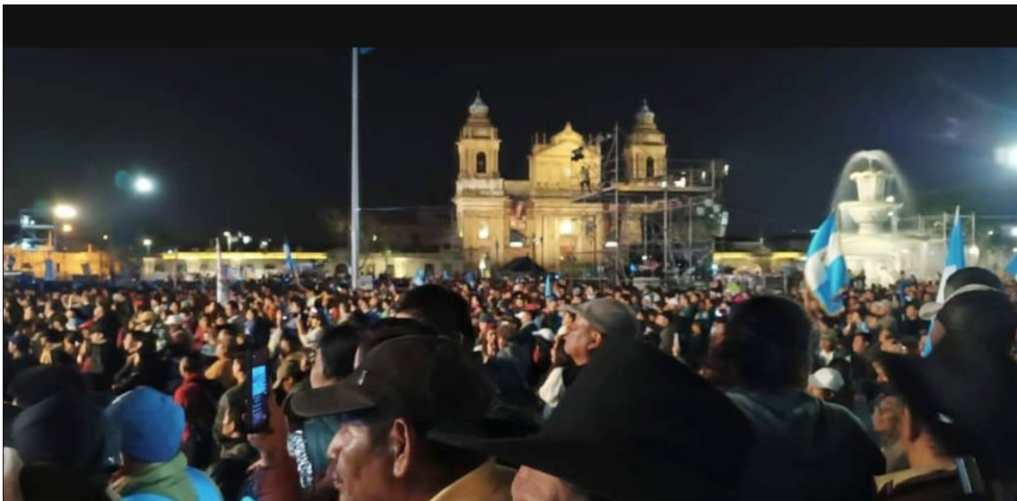
Rassemblement pour célébrer la prestation de serment du nouveau président guatémaltèque, le 15 janvier 2024

Les manoeuvres juridiques pour empêcher Arévalo d'assumer ses fonctions ont consisté à tenter de faire annuler les résultats des élections et à mener d'autres actions sous l'égide de la procureure générale Consuelo Porras. L'opposition de la population s'est traduite par 20 jours consécutifs de manifestations, y compris des grèves nationales et le blocage d'autoroutes stratégiques en octobre.