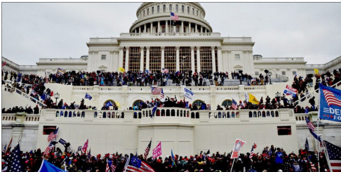
6 janvier 2021 : l'assaut du Capitole des États-Unis

Une affaire importante en instance devant la Cour suprême concerne une décision de la Cour suprême du Colorado exigeant le retrait de Donald Trump du scrutin pour avoir participé à une insurrection le 6 janvier 2021. La Cour entendra les arguments oraux le 8 février et pourrait décider de l'affaire avant les primaires du 5 mars dans cet État. L'importance de cette affaire fait l'objet d'une désinformation généralisée, qui se concentre sur la question de savoir si la Cour suprême est favorable ou pas à Trump, si le 6 janvier 2021 était ou non une insurrection et ce que disent ou ne disent pas la Constitution et le 14 e amendement, etc.