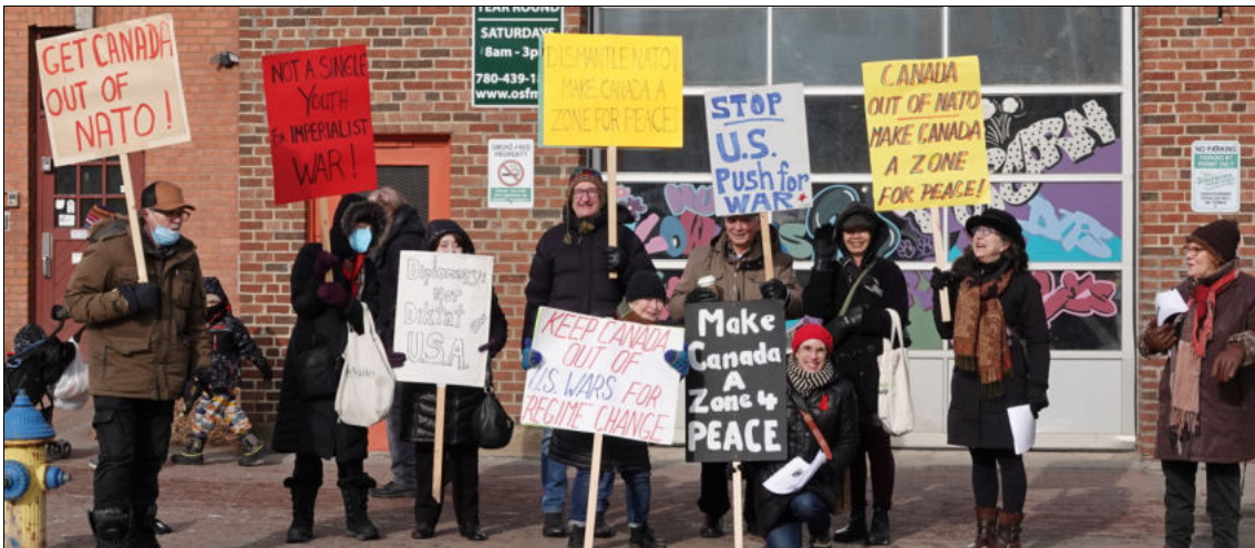
Piquet antiguerre d'Edmonton lors du premier anniversaire de la guerre par procuration des États-Unis/OTAN en Ukraine, le 25 février 2023

Ce que fait réellement la coalition et le rôle qu'y joue le Canada ne sont pas clairs, d'autant plus que l'Ukraine refuse d'entamer des négociations avec la Russie. C'est particulièrement le cas lorsqu'il s'agit de discussions sur la question centrale de la fin des combats, qui est décisive pour assurer le bien-être des enfants et résoudre les problèmes liés à leur déplacement. Cela soulève la question de l'objectif réel de cette coalition.