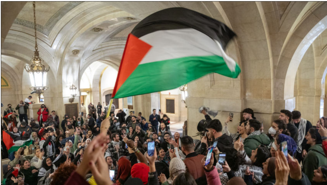
Le conseil municipal de Chicago vote pour un cessez-le-feu à Gaza, le 31 janvier 2024.

Les partis cartellisés bloquent également les tentatives des indépendants de se présenter aux élections primaires et générales. La procédure d'inscription sur les listes électorales est très complexe. Chaque État est différent, mais tous exigent un grand nombre de signatures à recueillir en peu de temps, signatures qui sont ensuite contestées par le cartel des démocrates et des républicains, dans le but d'exclure les indépendants du scrutin. Robert F. Kennedy Jr, Cornell West et Jill Stein font partie des candidats indépendants qui envisagent de se présenter à l'élection présidentielle, mais il est très peu probable qu'ils figurent sur le bulletin de vote dans plus de 25 des 50 États.