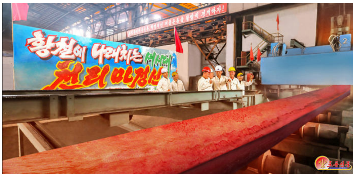
Le complexe sidérurgique de Hwanghae