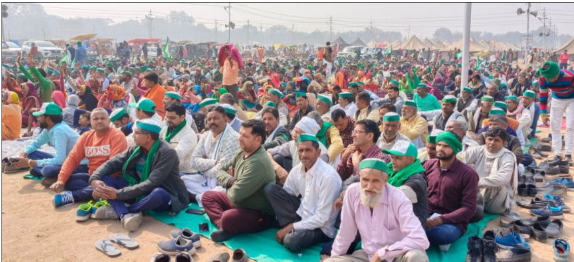
Convention nationale de la Bhartiya Kisan Union, 29 janvier 2024, Prayagraj, Uttar Pradesh

Des défilés de tracteurs ont ensuite été organisés dans tout le pays le 26 janvier et une grève nationale très réussie des agriculteurs et des travailleurs a eu lieu le 16 février.