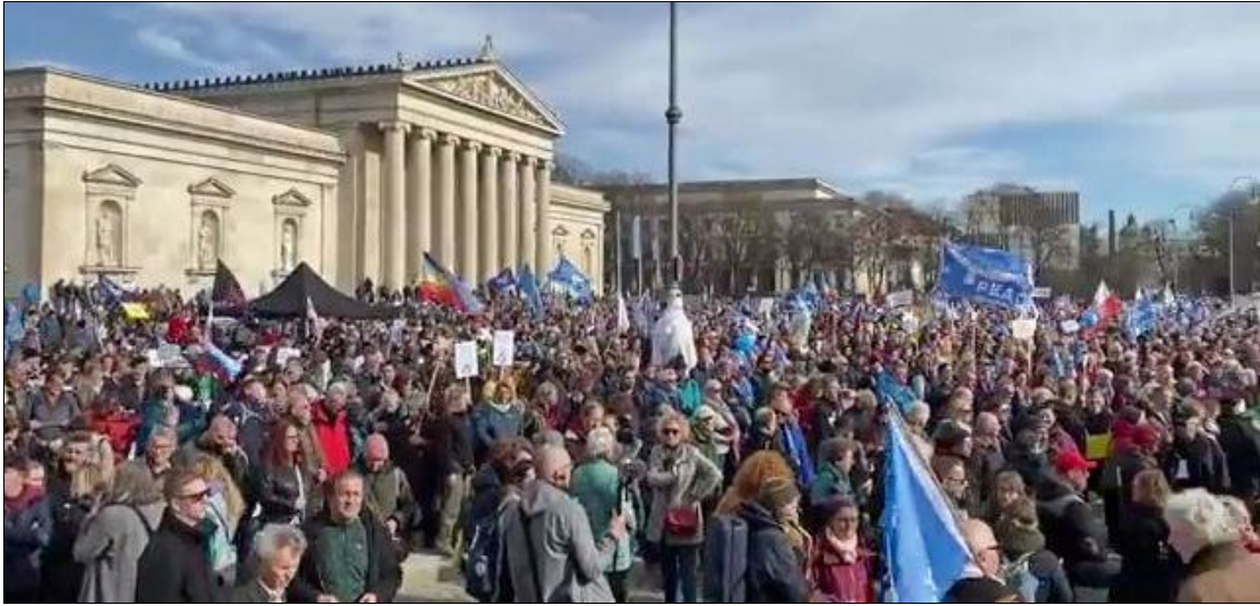
Manifestation devant la Conférence de Munich sur la sécurité, 17 février 2024

Cette année, 900 participants étaient présents, dont 50 chefs d'État et de gouvernement, plus de 100 ministres et des représentants de groupes de réflexion, d'ONG et du secteur privé. La ministre des Affaires étrangères du Canada, Mélanie Joly, a participé à la conférence pour « souligner le soutien continu du Canada à l'Ukraine face à la guerre d'agression de la Russie », les efforts du Canada pour « renforcer l'ordre international fondé sur des règles » ainsi que pour « discuter de la crise au Moyen-Orient ». La ministre a également rencontré ses homologues du G7 lors d'une réunion distincte en marge de la CSM.