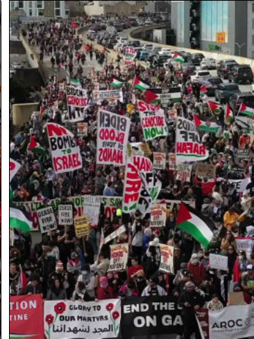
Le 19 février 2023, « jour des présidents », des milliers de personnes se rendent à San Francisco sur l'autoroute 101 pour dénoncer le soutien de l'administration Biden au génocide israélien dans la bande de Gaza.