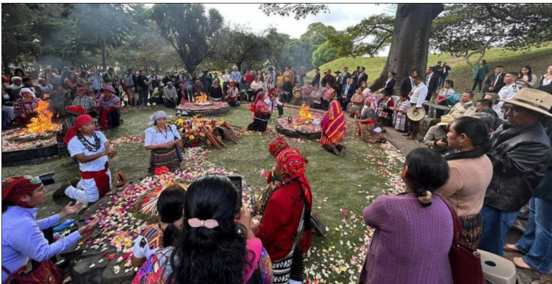
Le président Arévalo (photo du haut, premier plan à gauche) participe à une cérémonie maya, le 15 janvier 2024, marquant sa prestation de serment.

(Avec des informations de Prensa Latina, teleSUR, AP)