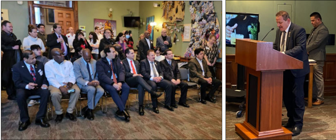
À gauche : Cérémonie à l'intérieur de Queen's Park. À droite : Le président de la Maison de la Palestine remercie Cuba pour son soutien au peuple palestinien.

remercié Cuba pour son soutien de longue date au peuple palestinien dans sa juste cause. De nombreuses autres personnes ont fait part de leurs félicitations et de leurs bons vœux pour Cuba au consul général et à son équipe.