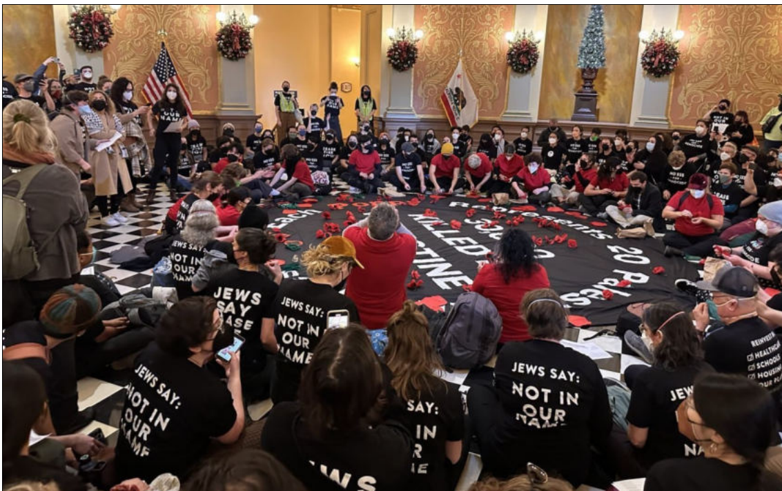
L'occupation de l'Assemblée législative de l'État de Californie pour exiger qu'elle prenne position en faveur d'un cessez-le-feu, 4 janvier 2024

Donald Trump, par exemple, a appelé à l'utilisation de la Loi sur l'insurrection , qui permet au président d'utiliser l'armée contre les manifestants, les grévistes qui résistent aux injonctions ou ceux qui bloquent les expéditions vers Israël, etc. Joe Biden, dont les forces soutiennent de nombreux procès intentés par les États contre Trump, pourrait utiliser les pouvoirs exécutifs pour qualifier les manifestations d'insurrection, de la même manière que les lois invoquant un soutien matériel au terrorisme sont désormais utilisées, en particulier contre ceux qui soutiennent la Palestine. Les actions où la police cible les manifestants qui occupent les capitales des États, par exemple, ou les bâtiments fédéraux de la Chambre des représentants ou du Sénat, qui se produisent déjà, pourraient également être considérées comme de l'insurrection. Les actions à la frontière, où Biden veut pouvoir fermer la frontière et où des troupes sont déjà présentes, pourraient être qualifiées de la sorte. En mettant l'insurrection au premier plan, on ouvre la voie à son utilisation contre le peuple pour réprimer les droits de s'exprimer, de se réunir et de s'organiser.