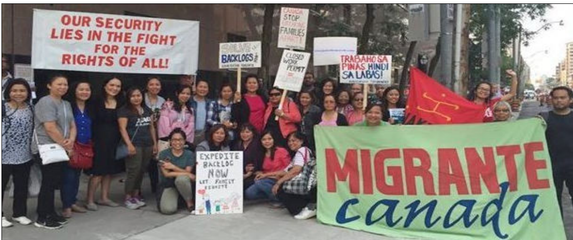
Manifestation à Toronto contre l'arriéré dans le traitement des demandes de résidence permanente des aides familiaux

Depuis le 30 avril, près de 5 700 aides familiaux et les membres de leur famille ont obtenu la résidence permanente en vertu des programmes actuels lancés en 2019, mais des milliers d'entre eux sont devenus sans papiers en raison de délais dans le traitement de leurs demandes ou en raison du processus d'exploitation qui fait qu'ils sont forcés de travailler dans des conditions d'oppression puis renvoyés chez eux sans aucune reconnaissance pour leur sacrifice.