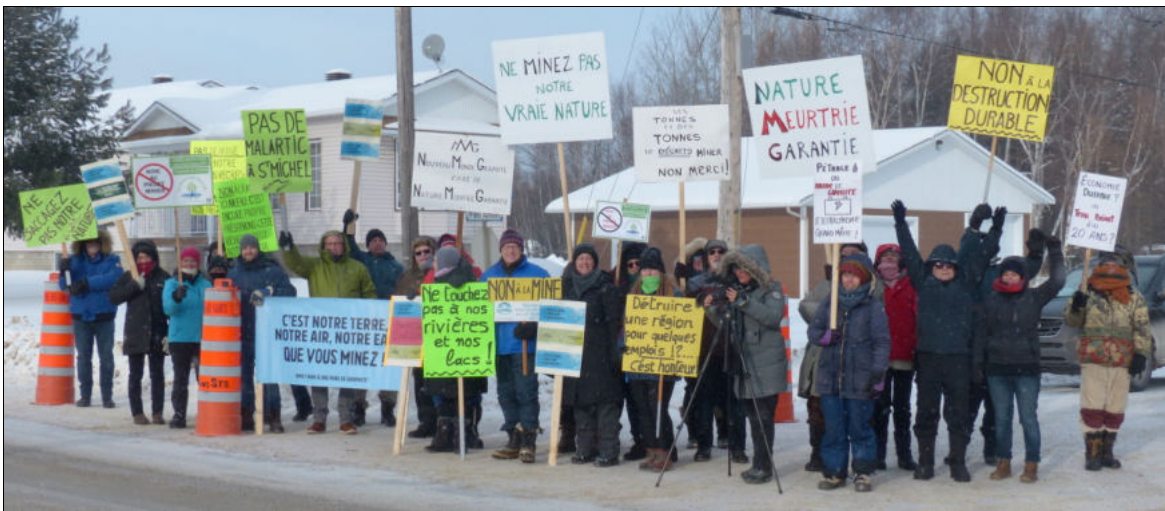
Manifestation par les résidents locaux en 2021 contre l'ouverture de la mine de graphite

Le 16 mai, le ministère canadien de l'Énergie et des Ressources naturelles et le Département américain de la Défense (DoD) ont annoncé qu'ils investissaient respectivement 4,9 millions canadiens et 8,4 millions de dollars US dans la société Lomiko Metals pour développer un gisement de graphite situé près de Duhamel, dans le sud-ouest du Québec, ainsi qu'un financement similaire de la part des mêmes agences canadiennes et américaines pour développer une mine de cobalt et bismuth dans les Territoires du Nord-Ouest.