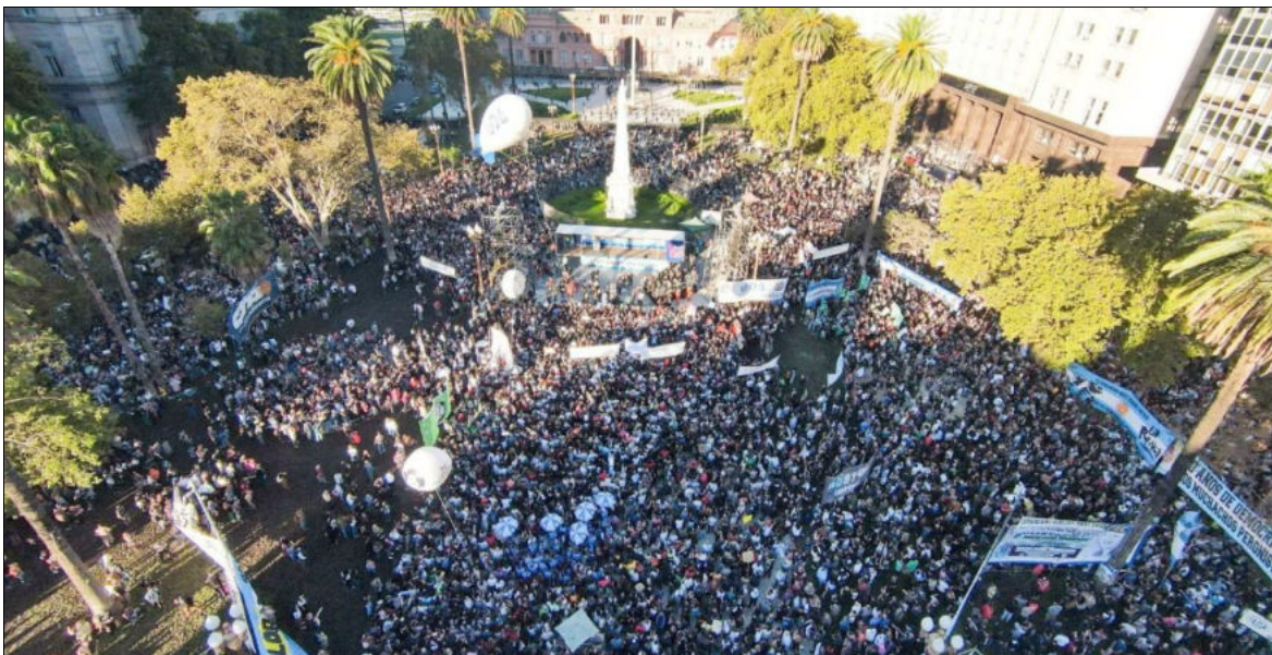
Manifestation à Buenos Aires contre l'offensive dans l'enseignement post-secondaire public, 23 avril 2024

Voici quelques-unes des dispositions du projet de loi tel qu'approuvé par la Chambre des députés et leurs conséquences pour le peuple argentin :