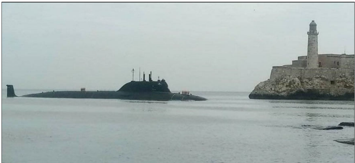
Un sous-marin nucléaire russe entre dans la baie de La Havane, le 12 juin 2024.

Le consensus aux États-Unis et au Canada est que les navires de guerre russes ne représentent aucun danger pour la région. La Russie a aussi qualifié de routine l'arrivée de navires de guerre à Cuba.