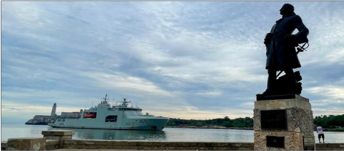
Le HMCS Margaret Brooke dans le port de la Havane, à Cuba, le 14 juin 2024

Plus tôt cette semaine, le 12 juin, les vaisseaux russes, le navire Admiral Gorshkov et le sous-marin nucléaire Kazan , accompagnés d'un pétrolier et d'un remorqueur, sont entrés dans le port de La Havane suite à des exercices de tirs de précision de missiles dans l'océan Atlantique. Le ministère de la Défense russe a dit que le navire et le sous-marin portaient des armes avancées, dont le missile de croisière hypersonique à capacité nucléaire Zircon .