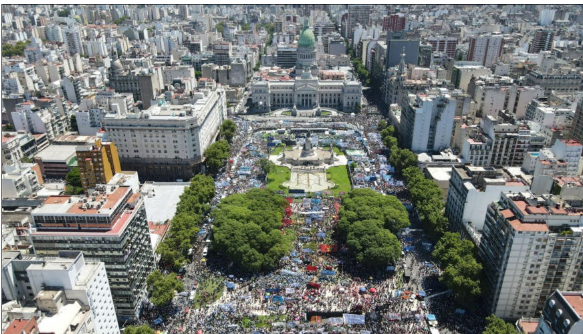
Manifestation à Buenos Aires, le 24 janvier 2024, contre le projet de loi omnibus

pour privatiser les entreprises publiques, éliminer le moratoire sur les retraites, créer un nouveau système d'incitation à l'investissement et introduire des réformes anti-ouvrières dans le domaine du travail.