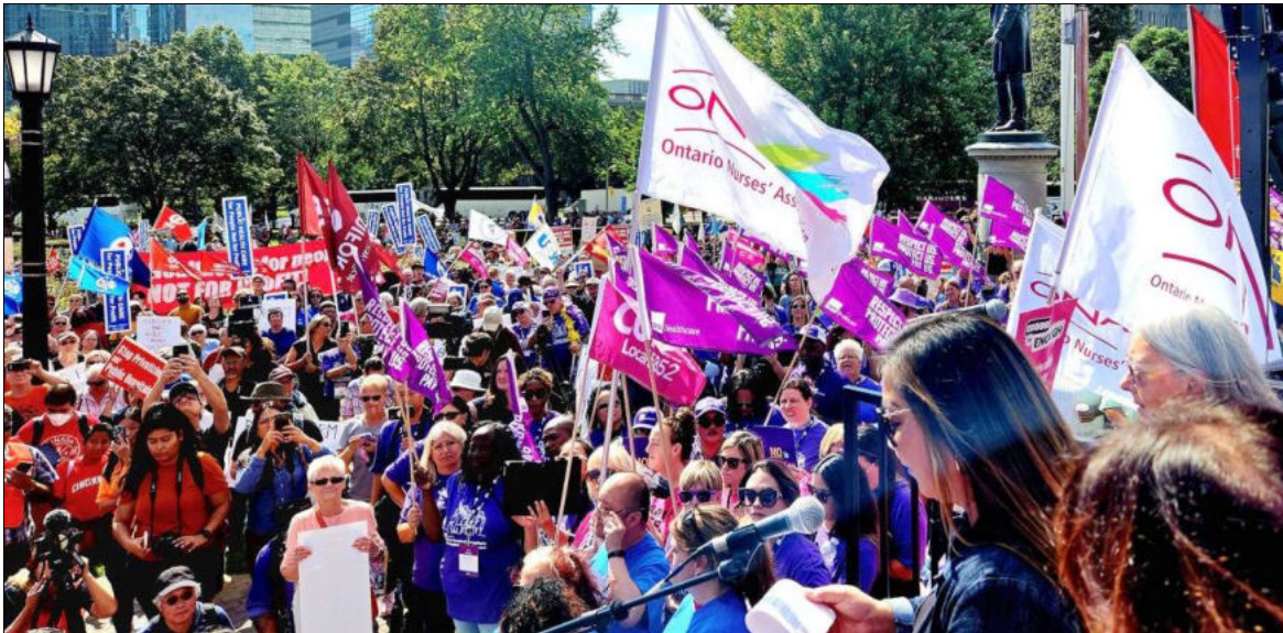
Rassemblement pour la santé publique à l'ouverture de l'Assemblée législative en Ontario, le 25 septembre 2023

Chaque jour, les Ontariens font l'expérience des impacts des mesures antisociales qu'un gouvernement après l'autre adopte au nom de grands idéaux. Le gouvernement Ford, dans son élan antisocial – spécifiquement pour la privatisation et le démantèlement du système de santé public – continue de renforcer les pouvoirs de police pour permettre des attaques inacceptables contre les plus vulnérables.