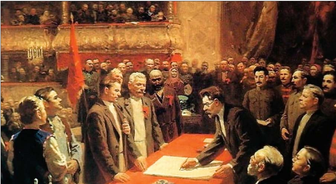
Signature de la déclaration et du traité sur la création de l'Union soviétique lors du Premier Congrès des Soviets de l'URSS

Nous célébrons aujourd'hui le 100e anniversaire de la création de l'Union des Républiques socialistes soviétiques (URSS). Ce fut une grande victoire pour la révolution socialiste et la construction socialiste. Aujourd'hui encore, l'exemple donné par l'État constitué sur une base révolutionnaire annonce la naissance du nouveau.