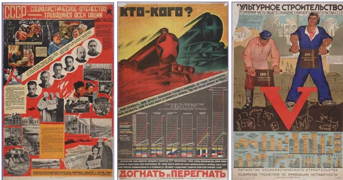
Affiches montrant la construction du socialisme en URSS dans les années 1920. De gauche à droite : «L'URSS est la patrie socialiste de toutes les nations» ; «Qui battra qui ?» Les plans soviétiques pour dépasser les principaux États capitalistes dans diverses branches de l'industrie ; «La construction culturelle fait partie intégrante de la construction socialiste générale de l'URSS.» Cliquez pour agrandir.

L'URSS a donné à l'humanité des concepts tels que l'affranchissement de l'exploitation, l'éducation et les soins de santé universels et gratuits et l'amitié et la fraternité des nations. Le socialisme a prouvé sa vitalité face à l'intervention concertée de quatorze États qui ont voulu écraser la Russie soviétique après la victoire de la Grande Révolution d'Octobre. Il l'a prouvé encore deux décennies plus tard dans la lutte contre le nazi, le fascisme et le militarisme japonais. Le socialisme a permis à l'URSS de faire un immense bond en avant dans l'industrialisation et dans le développement de l'agriculture, le progrès social et les droits des citoyens, ainsi que dans le développement des arts et de la culture et dans les domaines de la science et de la technologie, y compris le premier vol dans l'espace. L'URSS a également apporté un soutien inestimable aux luttes de libération nationale contre les anciennes puissances coloniales.