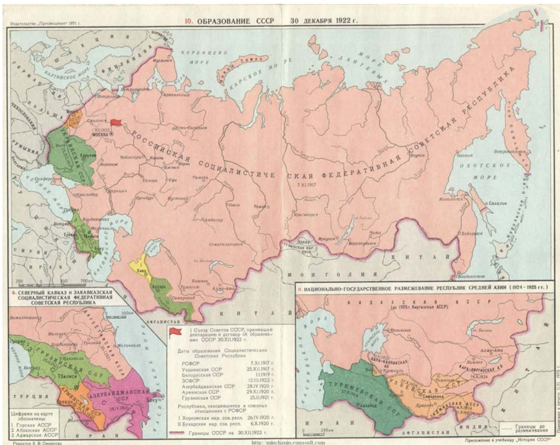
Carte de l'URSS en 1922, composée à l'époque de la République socialiste fédérative soviétique de Russie, de la République socialiste soviétique d'Ukraine, de la République socialiste fédérative soviétique de Transcaucasie et de la République socialiste soviétique de Biélorussie. Cliquez pour agrandir.

Camarades, cette journée marque un tournant dans l'histoire du pouvoir des Soviets. Elle pose des jalons entre l'ancienne période, dépassée désormais, où les républiques soviétiques, bien qu'agissant de concert, marchaient séparément, préoccupées avant tout du problème de leur existence, et de la période nouvelle, déjà commencée, où un terme est mis à l'existence isolée des Républiques soviétiques, où celles-ci s'unissent en un seul État fédératif pour combattre efficacement le délabrement économique, où le pouvoir des Soviets songe non seulement à se maintenir en vie, mais aussi à devenir une force internationale sérieuse, capable d'exercer une influence sur la situation internationale, capable de la modifier dans l'intérêt des travailleurs.