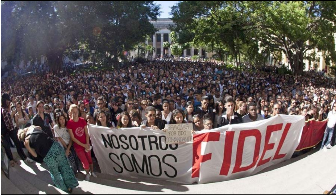
De jeunes Cubains commémorent Fidel, 28 novembre 2016.