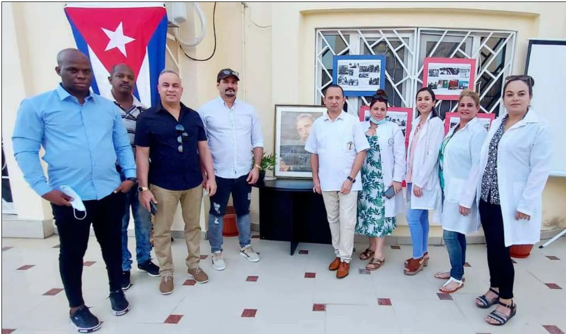
Des travailleurs de la santé à l'hôpital pédiatrique José Martí à Sancti Spiritus dans une publication en hommage à Fidel, le 24 novembre 2022