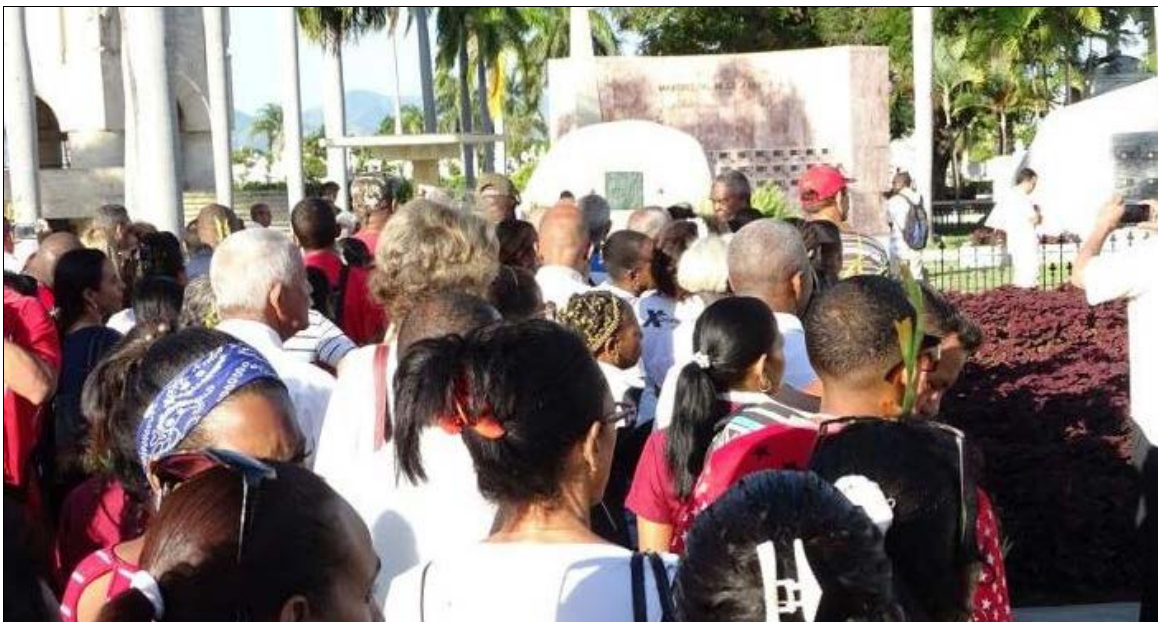
Cérémonie du 25 novembre 2022 sur la tombe de Fidel au cimetière de Santa Ifigenia à Santiago de Cuba

Le 25 novembre, à Cuba, un événement a eu lieu à l'aube à la tombe de Fidel au cimetière Santa Ifigenia à Santiago de Cuba avec la participation du général d'armée Raul Castro, des membres du Conseil des ministres et d'autres dignitaires.