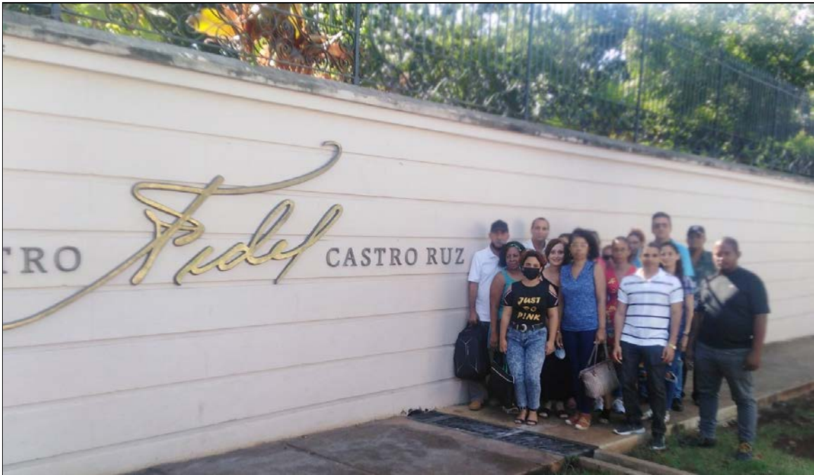
Les Cubains rendent hommage à Fidel au centre Fidel Castro Ruz à la Havane, le 24 novembre 2022