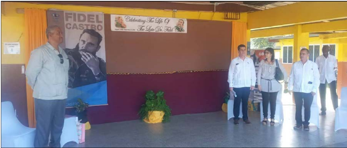
Au campus Fidel Castro de l'école secondaire d'Anchovy à Anchovy, en Jamaïque, les membres du corps diplomatique à la Jamaïque se joignent à des enseignants, des étudiants et des membres du mouvement de solidarité pour commémorer Fidel, le 24 novembre 2022.