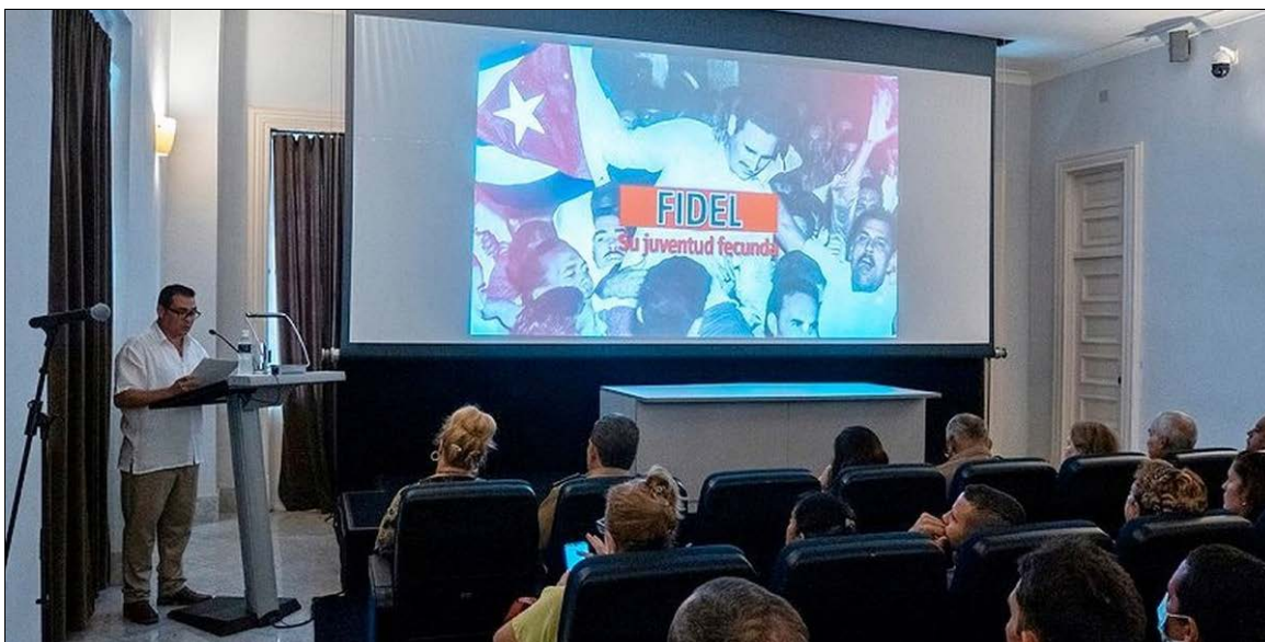
Un nouveau documentaire sur Fidel est présenté à la Havane le 23 novembre 2022.

Le 23 novembre, le Centre Fidel Castro Ruz de la Havane a présenté un nouveau documentaire de 27 minutes intitulé « Fidel su juventud fecunda » (Fidel, sa jeunesse féconde), qui souligne la vie de Fidel durant cette période. En particulier, par le biais d'entrevues avec des personnalités, des universitaires et des historiens cubains, le film souligne des faits saillants peu connus de l'enfance et de la jeunesse du dirigeant révolutionnaire avant sa participation à l'attaque contre la Caserne Moncada le 26 juillet 1953. Le film est accompagné d'une présentation multimédia de photos et de vidéos. Cette production audiovisuelle servira de base pour approfondir la connaissance de Fidel enfant, adolescent et jeune adulte par la jeunesse Cubaine en offrant aux nouvelles générations une vision plus globale de Fidel en tant que patriote, penseur, révolutionnaire et être humain. Le film et la présentation multimédia seront diffusés dans les centres éducatifs partout au pays.