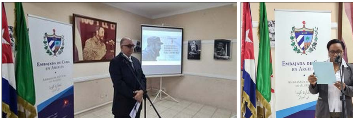
L'ambassade de Cuba en Algérie rend hommage à Fidel, le 24 novembre 2022.