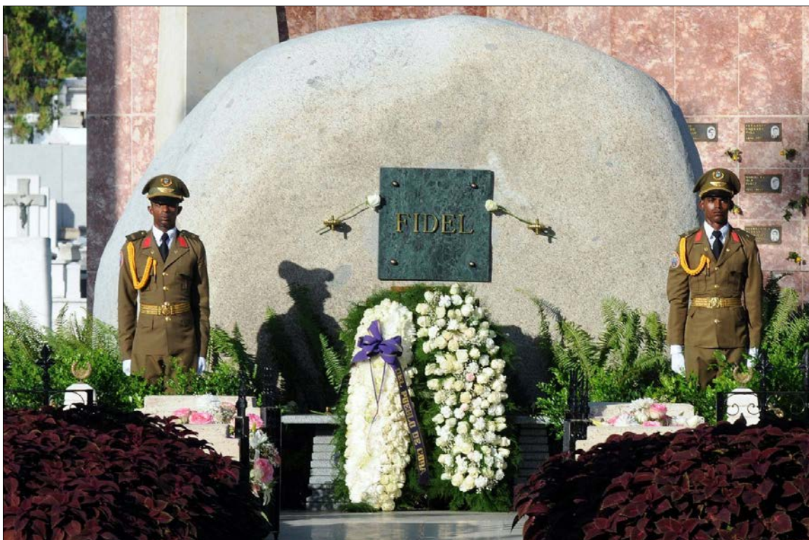
La tombe de Fidel au cimetière de Santa Ifigenia à Santiago de Cuba où il prend place parmi le panthéon des héros cubains

Honorons la mémoire de Fidel Castro de manière concrète, en étant solidaire de la Révolution cubaine par les actions du mouvement d'amitié et de solidarité avec Cuba, en renforçant le mouvement contre la guerre, en maintenant les relations fraternelles entre Cuba et le Canada et en s'opposant à toute ingérence étrangère dans les affaires intérieures de Cuba.