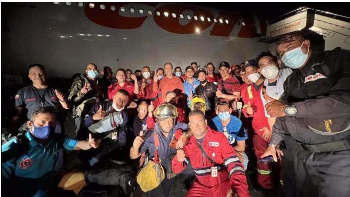
Des spécialistes du Venezuela arrivent pour aider à combattre les incendies.

mouvement de solidarité mondial, une force puissante s'est rassemblée pour maîtriser les incendies, pleurer les morts et lutter pour les vivants.