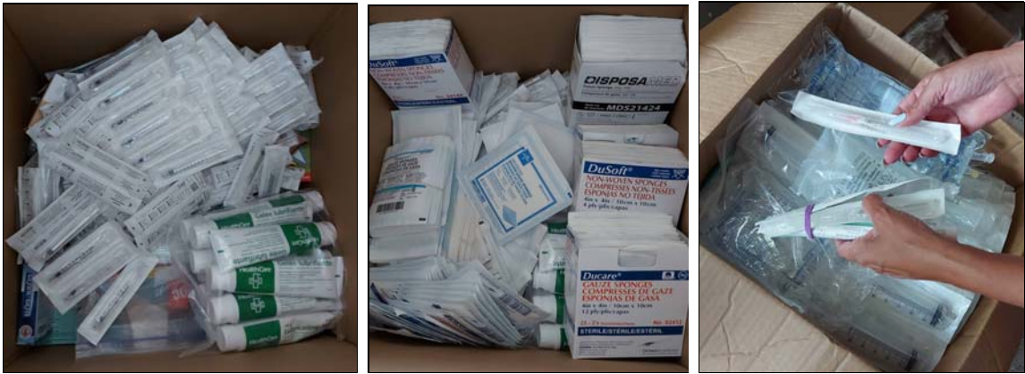
À Toronto, des membres de l'Association des Cubains résidant au Canada et des amis de Cuba préparent des envois de fournitures médicales pour aider aux efforts de secours à Matanzas, 9 août 2022.