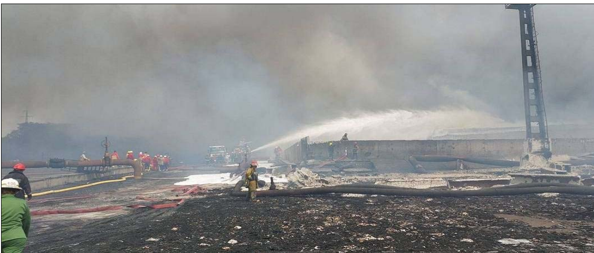
Les forces cubaines, ainsi que le personnel de la PDVSA et de PEMEX, utilisent de l'eau et de la mousse sur les restes du quatrième réservoir, le 10 août 2022.

Les gouvernements de plusieurs pays ont proposé rapidement une aide concrète. La première arrivée, dans la soirée du samedi 6 août, a été une cargaison de matériel de lutte contre les incendies et de spécialistes de la Compagnie pétrolière mexicaine (Pemex) et les forces armées du pays envoyés par le président mexicain Andrés Manuel Lopez Obrador. Ils ont été rejoints peu après par des pompiers et d'autres spécialistes de la compagnie pétrolière publique vénézuélienne PDVSA envoyés par le président Nicolas Maduro. Ils ont également apporté de la mousse et des substances chimiques pour éteindre l'incendie et empêcher sa propagation. Depuis, plus de 20 vols sont arrivés du Mexique et du Venezuela avec des équipements et du matériel. Le Mexique a également envoyé deux navires d'aide. Un avion apportant de l'aide de Bolivie est arrivé le 11 août. Une aide matérielle et financière a également été envoyée par plusieurs autres pays.