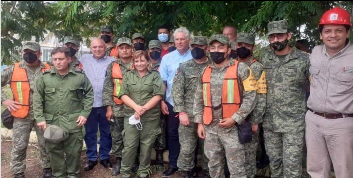
Le président Miguel Díaz-Canel parmi les pompiers au dépôt de carburant de Matanzas

Les habitants de Matanzas et d'autres régions de Cuba se sont immédiatement mobilisés pour offrir toute l'aide possible aux blessés et aux membres des familles des personnes disparues ainsi qu'aux pompiers, aux travailleurs d'urgence et aux personnes évacuées de leur domicile. Ils fournissent de la nourriture, des boissons, du transport gratuit et d'autres biens et services, ouvrent leur maison aux évacués et donnent du sang et des médicaments.