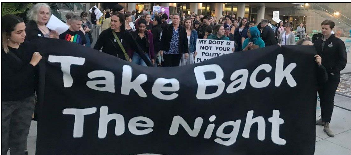
Kitchener, Ontario, 19 septembre 2019