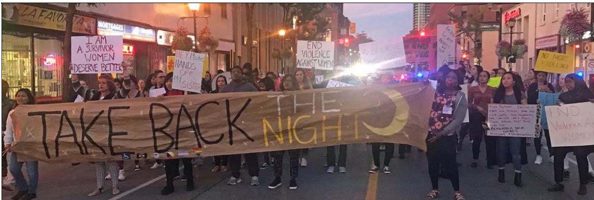
Brampton, Ontario, 19 septembre 2019