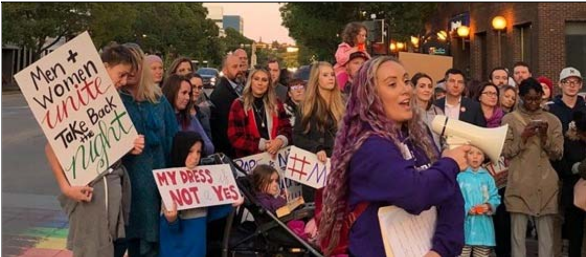
Red Deer, Alberta, 20 septembre 2019