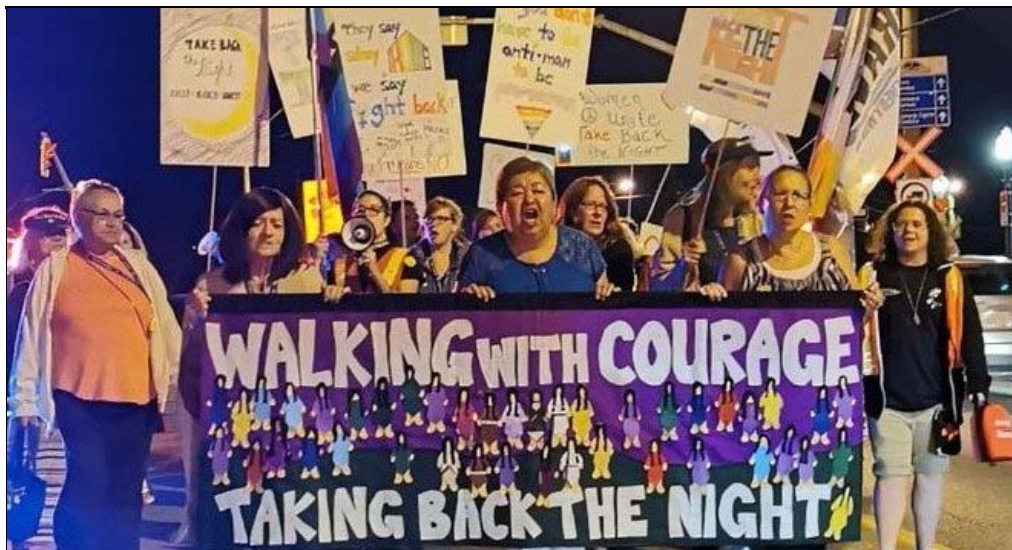
Brantford, Ontario, 19 septembre 2019