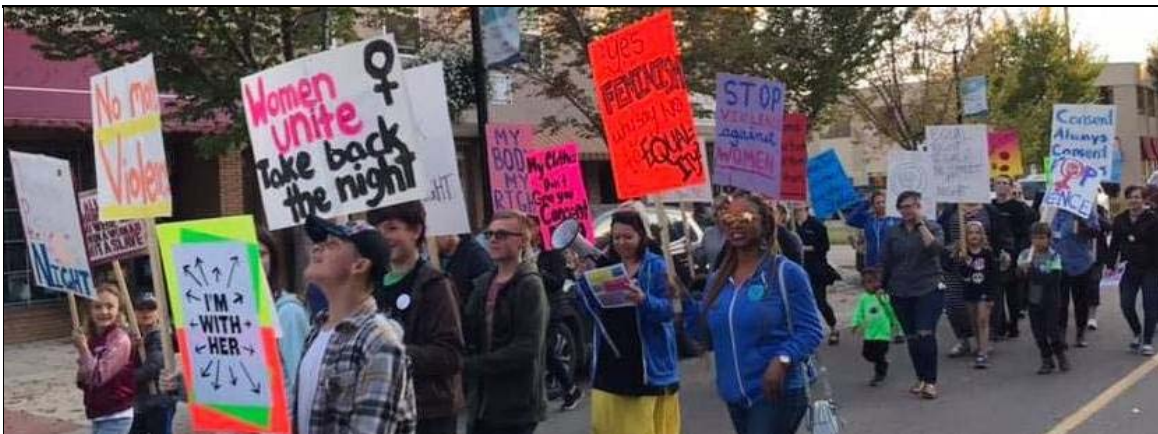
Fort Saskatchewan, 20 septembre 2019