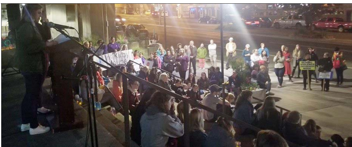
St. John's, Terre-Neuve, 20 septembre 2019