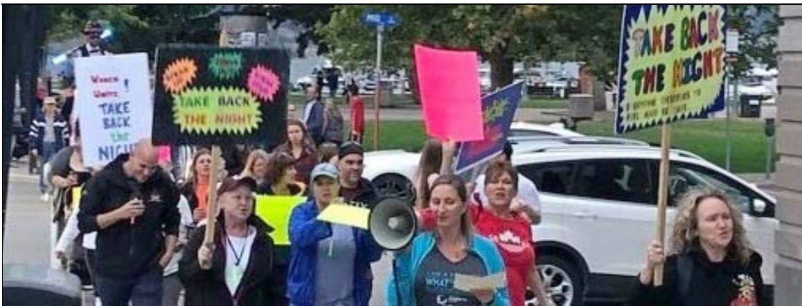
Kelowna, Colombie-Britannique, 12 septembre 2019