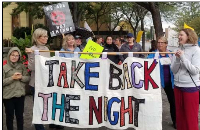
Kamloops, Colombie-Britannique, 12 septembre 2019