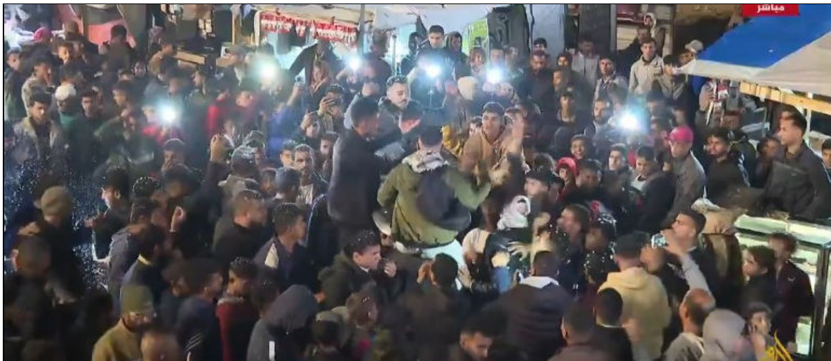
Célébration de l'annonce de l'accord de cessez-le-feu, à Gaza le 16 janvier 2025