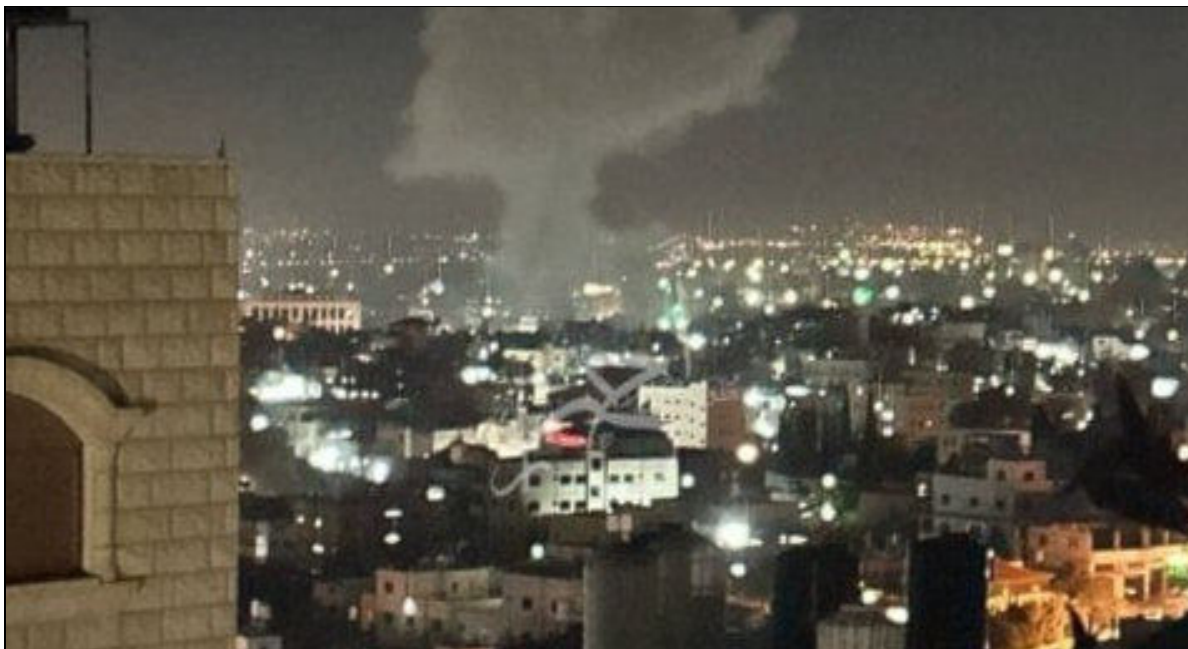
Fumée s'élevant d'une frappe aérienne israélienne sur un café dans le camp de réfugiés de Tulkarm, le 3 octobre 2024

Dix-huit Palestiniens ont été tués et plusieurs autres blessés lors d'une frappe aérienne dans la soirée du 3 octobre, qui visait un café du camp de réfugiés de Tulkarm, situé dans le nord de la Cisjordanie occupée. Les avions de guerre israéliens ont lancé au moins un missile sur le café situé dans le quartier d'al-Hamam, où se trouvaient plusieurs Palestiniens, principalement des femmes et des enfants.