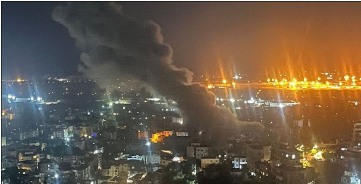
Les frappes aériennes sur Beyrouth (Liban) se poursuivent pendant la nuit du 4 au 5 octobre 2024.

Le 4 octobre, pour la douzième journée consécutive, Israël a poursuivi sa guerre sanglante contre le Liban. À l'aube du vendredi 4 octobre, l'armée d'occupation a lancé le bombardement le plus violent à ce jour sur la banlieue sud de Beyrouth, alors qu'on apprenait qu'un nouvel assassinat avait été commis. Des sources de sécurité ont rapporté à Reuters que l'attaque israélienne sur la banlieue sud de Beyrouth était plus importante que celle qui a tué le secrétaire général du Hezbollah Sayyed Hassan Nasrallah, au cours de laquelle 83 bombes de type « bunker-buster » ont été lancées. Mazen Ibrahim, chef du bureau d' Al Jazeera à Beyrouth, a décrit l'attaque comme la plus puissante en termes de force de