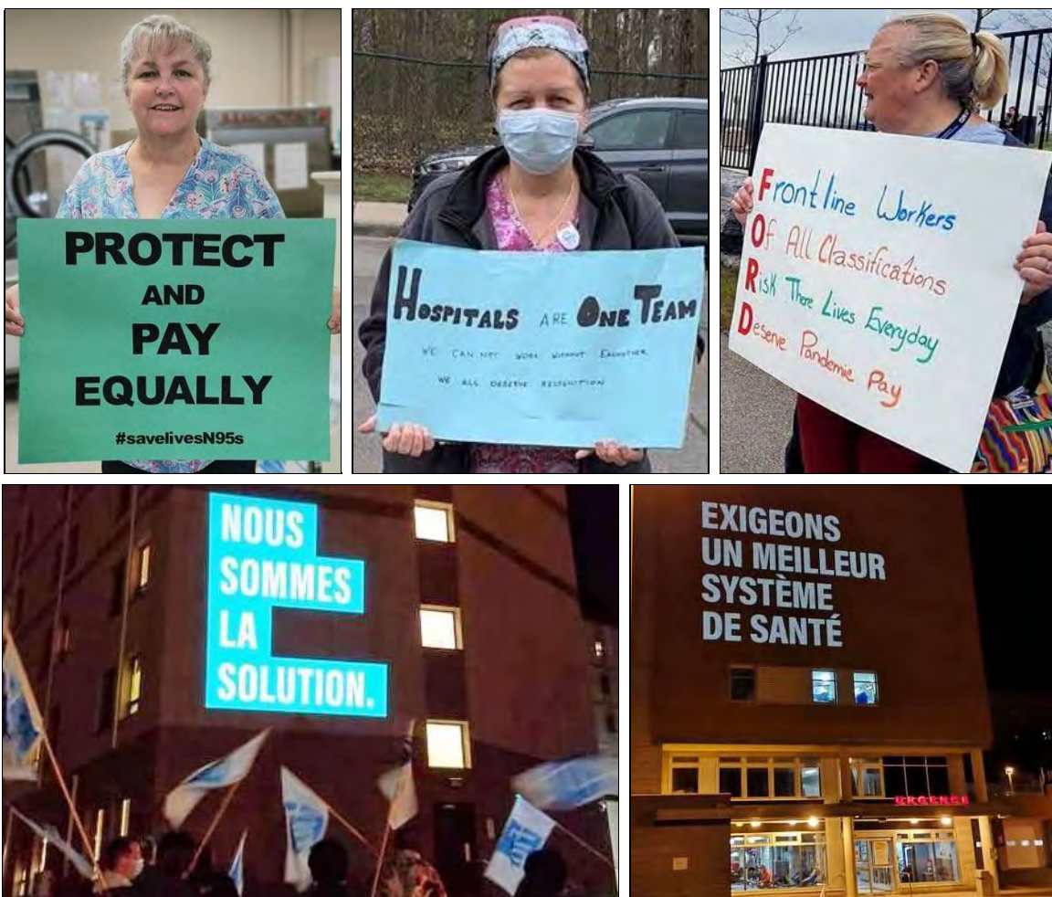
Des travailleurs de la santé de l'Ontario et du Québec exigent des conditions de travail adéquates et le renversement des compressions pendant la pandémie.

d'issue à la pandémie et aux crises politiques et économiques !