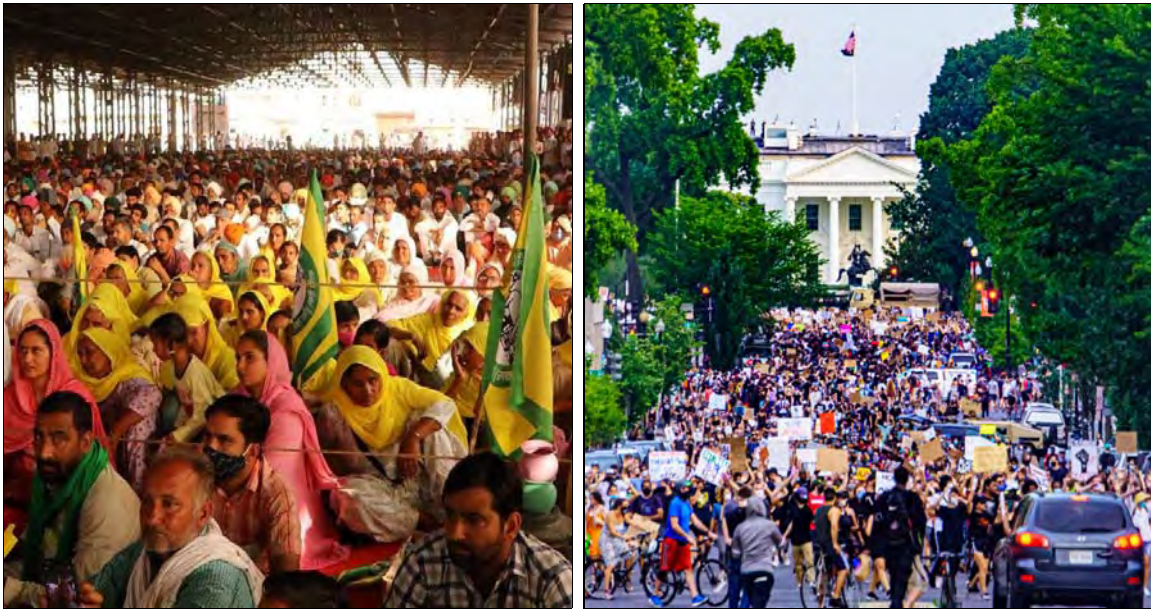
Les fermiers indiens tiennent un grand rassemblement ( mahapanchayat ) à Rajasthan le 13 mars 2021. À droite: manifestations contre le racisme et la brutalité et l'impunité policières à Washington le 3 juin 2020.

commettent également d'innombrables crimes contre l'humanité et Mère Nature. Cela veut dire que c'est à la classe ouvrière de tous les pays de se constituer en la nation et d'investir le peuple du pouvoir décisionnel souverain. Le peuple doit devenir celui qui fait l'histoire à son image, avec ses propres objectifs qui sont ceux de l'humanité. C'est l'objectif d'humaniser l'environnement naturel et social et de faire naître le Nouveau sur cette base.