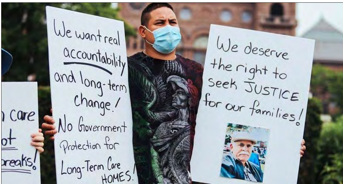
Actions des travailleurs et des familles de résidents de centres de soins de longue durée

Une autre chose que nous avons apprise est que c'est grâce aux luttes que mènent les travailleurs que les Canadiens ont maintenant une bien meilleure idée de l'état de l'économie canadienne, de qui la contrôle et de qui elle sert, et de la nécessité de priver ceux qui contrôlent le pouvoir décisionnel de leur pouvoir de nous priver de ce qui nous appartient de droit.