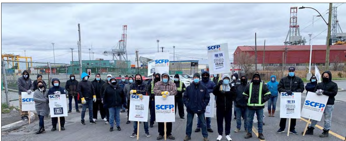
Les débardeurs de Montréal déclenchent la grève le 26 avril contre les modifications unilatérales à leurs conditions de travail.