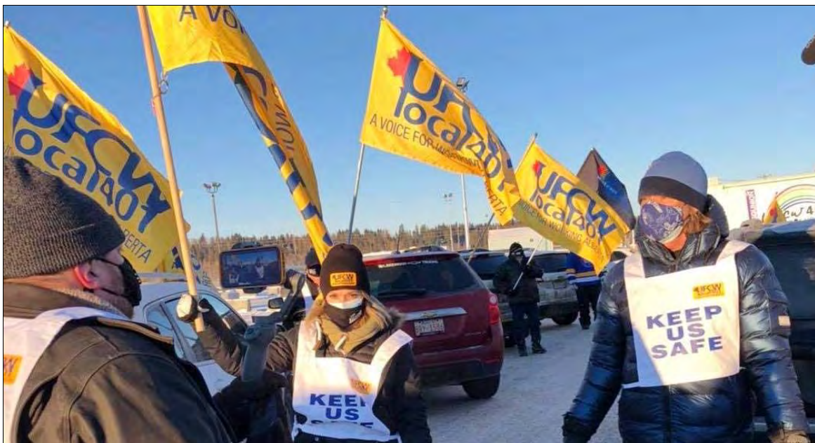
Le 18 février 2021, des membres des TUAC manifestent devant l'usine Olymel à Red Deer pour exiger la fermeture de l'usine à cause de conditions non sécuritaires.

Mais les luttes dans nos mines, nos usines, nos ports, nos réseaux de transport et de communication, et les services de toutes sortes, dans le commerce, dans l'industrie hôtelière, dans les camps de travail — le montrent également. Nous devons reconnaître que seulement 25 % des travailleurs au Canada sont syndiqués, et cela inclut 30 % au Québec. En cette occasion, nous saluons les syndicats qui défendent leurs membres, mais aussi le grand nombre d'organisations qui existent à travers le pays pour regroupe les travailleurs qui n'ont aucune autre voix ou représentation. Nous les appelons des organisations de défense des droits car elles ne sont pas des syndicats et, si beaucoup d'entre elles regroupent les travailleurs non syndiqués en syndicats, d'autres ont simplement relevé le défi de s'assurer que les travailleurs aient une voix pour exprimer et représenter les demandes collectives qu'ils ont eux-mêmes présentées. Ces groupes de défense des droits organisent les migrants, les communautés minoritaires, les personnes âgées et, bien sûr, les camionneurs, les travailleurs indépendants et d'autres personnes que les gouvernements ont arbitrairement déclarées comme n'étant pas des travailleurs, dans le but de s'assurer qu'elles ne bénéficient d'aucune protection collective et qu'elles peuvent être ballottées à leur guise.