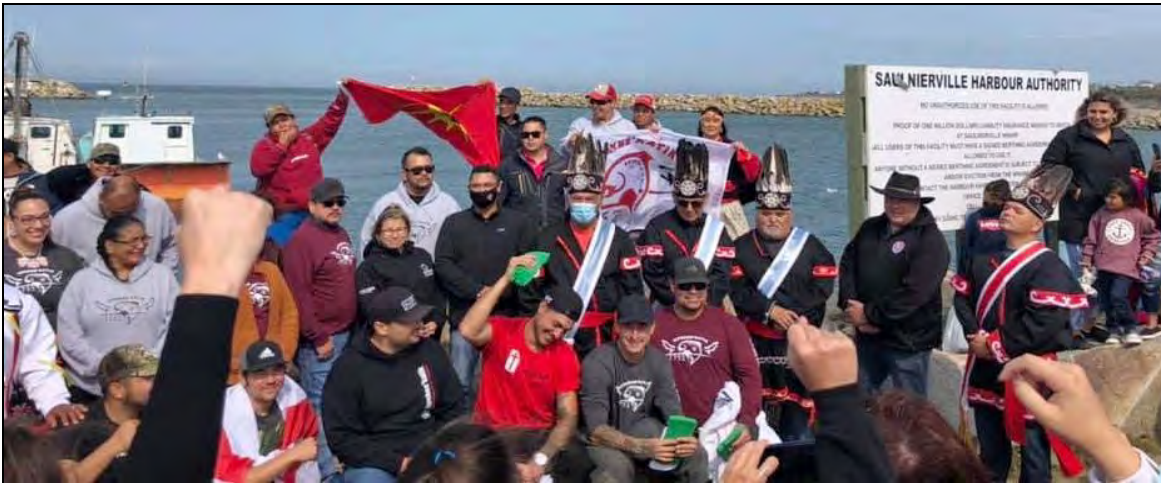
Les pêcheurs du homards mi'kmaq affirment leur droit de réglementer leur pêche le 17 septembre 2020.