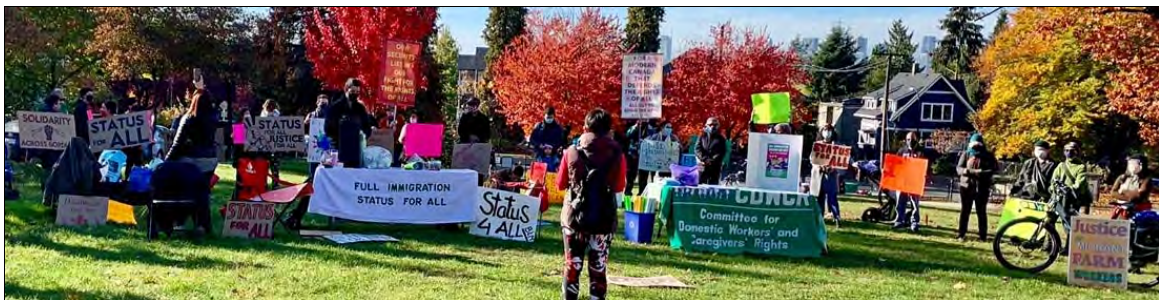
Manifestations partout au Québec et au Canada pour exiger des conditions de travail sécuritaires et un plein statut pour tous les travailleurs

Aujourd'hui, au sein même de nos frontières la classe ouvrière est devenue internationale. Son expérience et ses conditions de travail sont devenues mondiales. Les informations que nous partageons sont communes à tous et chaque contribution que nous sommes en mesure d'apporter, aussi petite soit-elle, est significative. Elle est importante. Elle contribuera à faire évoluer les choses en faveur de la classe ouvrière et des peuples.