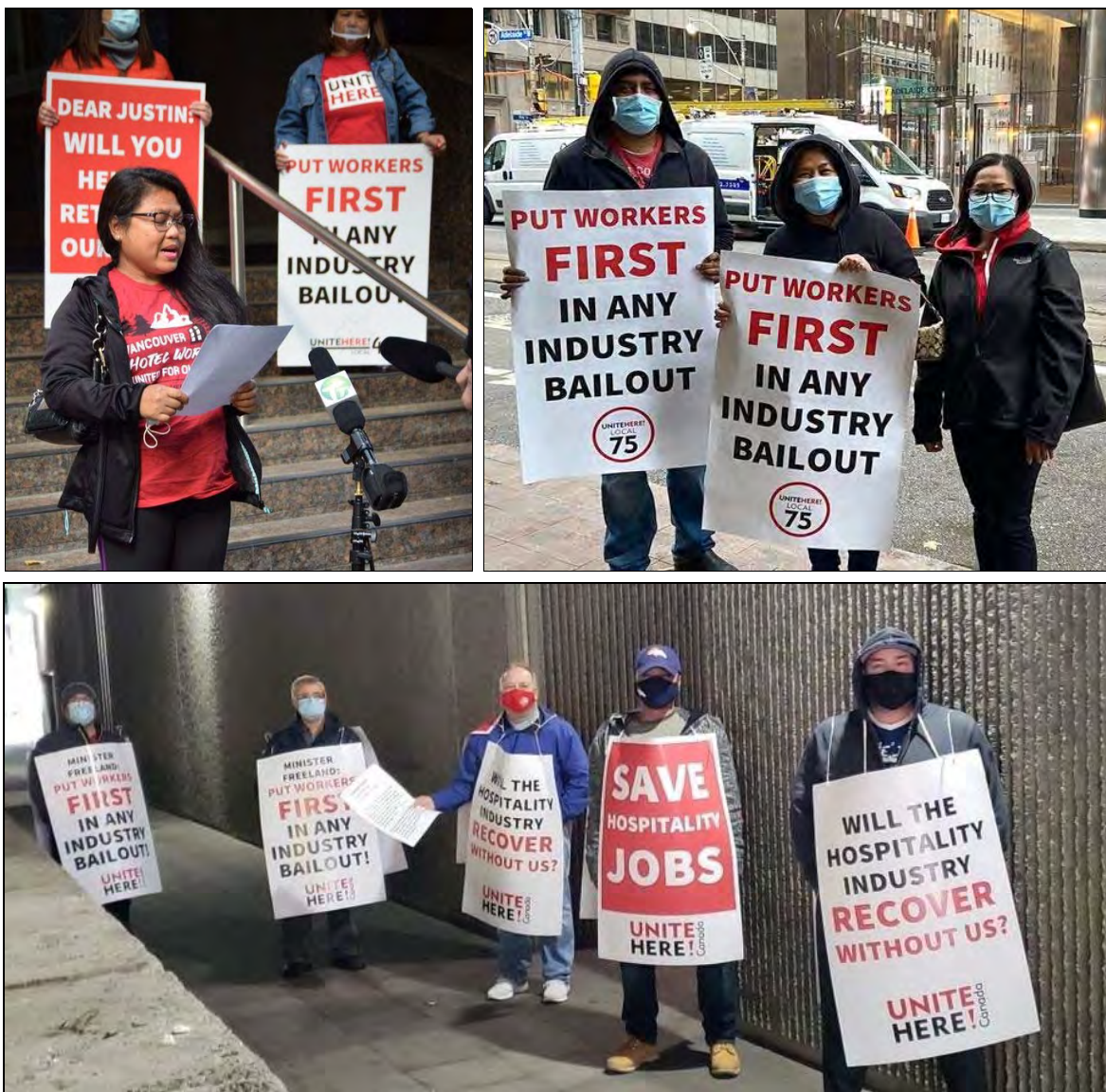
Les travailleurs de l'hôtellerie de Vancouver, Vancouver et Ottawa s'opposent aux atteintes à leurs droits et à leurs moyens de subsistance sous prétexte de pandémie, octobre 2020.

Une humanité, une lutte ! Travailleurs et opprimés de tous les pays, unissez-vous !