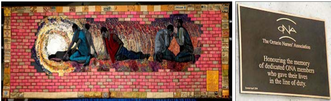
De gauche à droite : à Toronto, monument aux travailleurs tués dans le désastre de Hoggs Hollow ; plaque commémorative à Toronto aux infirmières mortes au travail pendant l'épidémie de SRAS de 2003