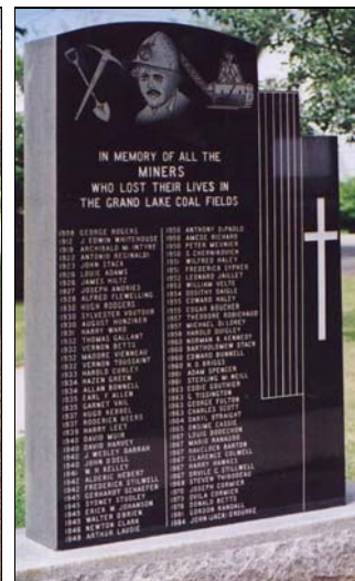
De gauche à droite : Bathurst, au Nouveau-Brunswick, monument aux travailleurs de la forêt, des mines et des fonderies ; New Waterford, en Nouvelle-Écosse, monument à Bill Davis qui fut tué durant une grève des mineurs ; monument aux mineurs de charbon du Nouveau-Brunswick