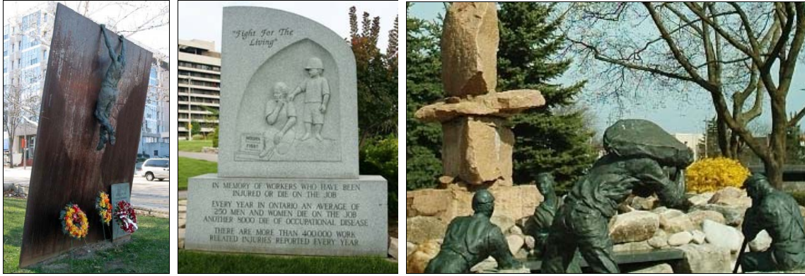
Hamilton, monument de la Journée de commémoration du 28 avril ; monument de la Journée de commémoration à Windsor ; monument dédié aux travailleurs du canal Welland