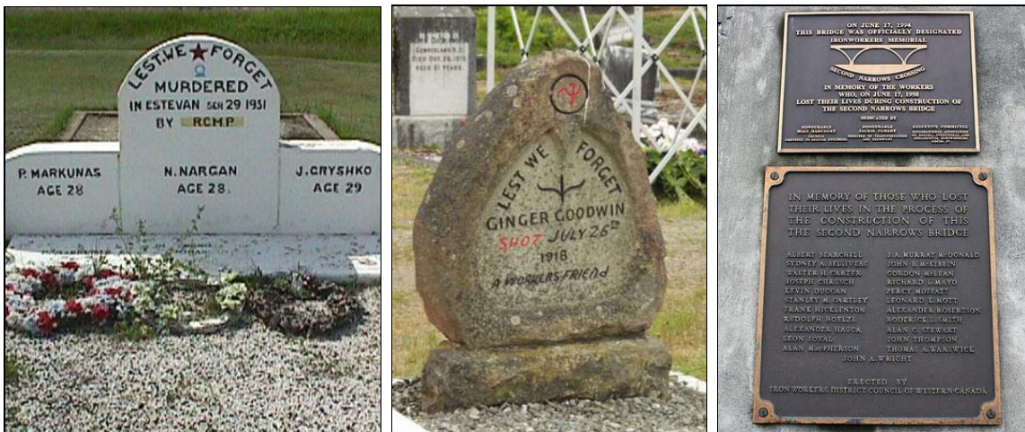
De gauche à droite : pierres tombales des mineurs du charbon d'Estevan en Saskatchewan tués en défendant le droit des travailleurs de s'organiser : la tombe de l'organisateur des mineurs et opposant à la guerre Ginger Goodwin de Cumberland en Colombie-Britannique ; monument à Vancouver en hommage aux dix-neuf monteurs d'acier tués en 1958 lorsqu'une section du pont Narrows s'est effondré pendant la construction