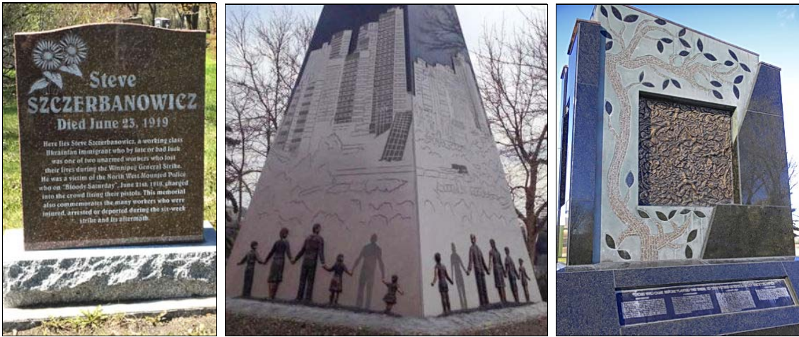
De gauche à droite : pierre tombale d'un des travailleurs tués durant la grève générale de Winnipeg en 1919 ; monument de la Journée de commémoration à Edmonton ; monument en hommage aux travailleurs du rail à Calgary