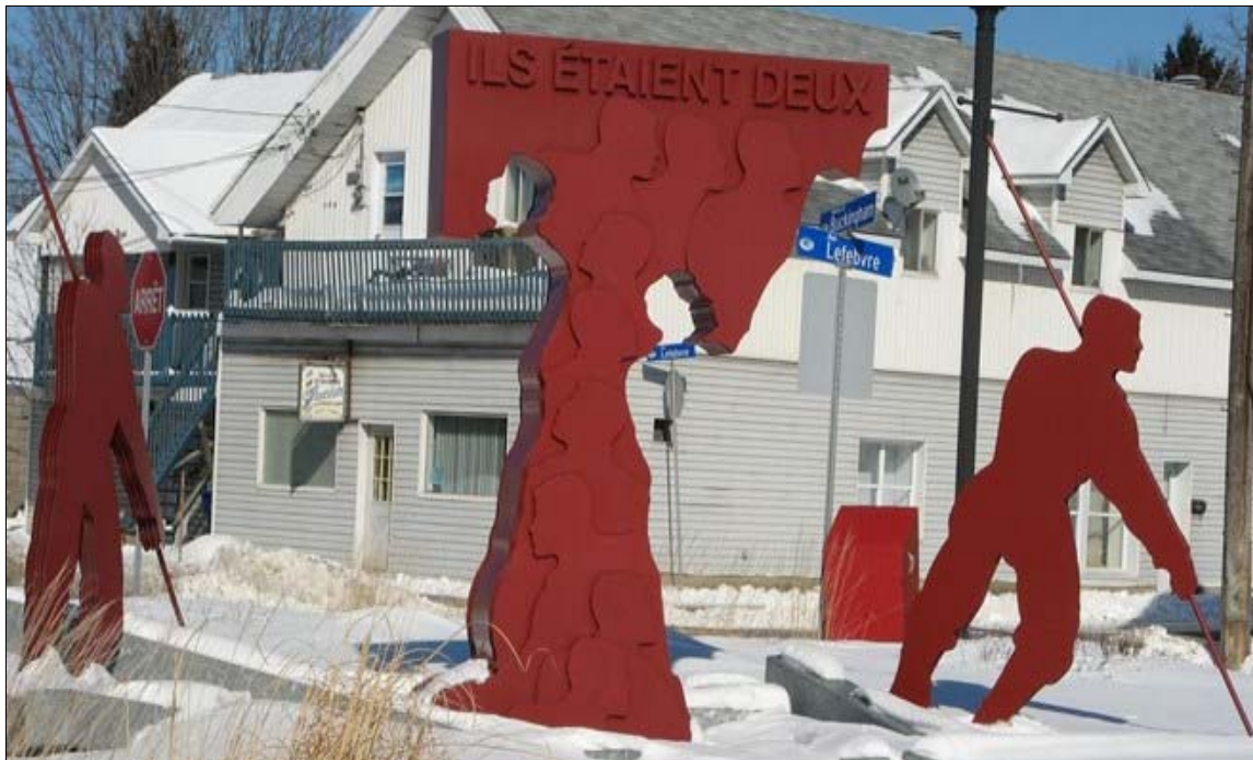
Monument à Buckingham au Québec en hommage aux travailleurs forestiers tués pendant leur lutte pour syndiquer les moulins MacLaren