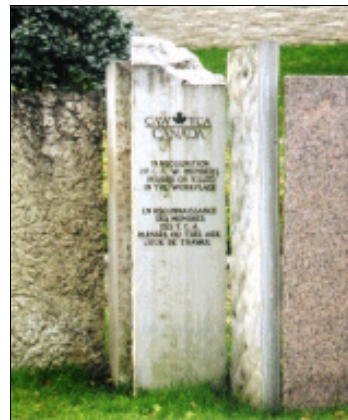
De gauche à droite : Kirkland Lake, monument aux mineurs de l'Ontario ; monument aux bûcherons de Blind River, en Ontario ; Port Elgin, monument aux travailleurs de l'automobile de l'Ontario