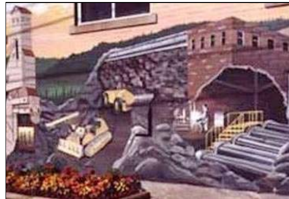
De gauche à droite : monument en hommage aux mineurs de Sudbury ; détails du mémorial à Sudbury ; murale commémorative de Sudbury en hommage aux travailleurs tués dans la catastrophe de Falconbridge en 1929