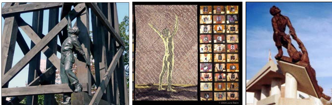
De gauche à droite : à Toronto, monument aux travailleurs chinois du rail ; courtepoinette commémorative pour les jeunes travailleurs tués à l'ouvrage ; monument en hommage aux travailleurs italiens à Woodbridge, en Ontario