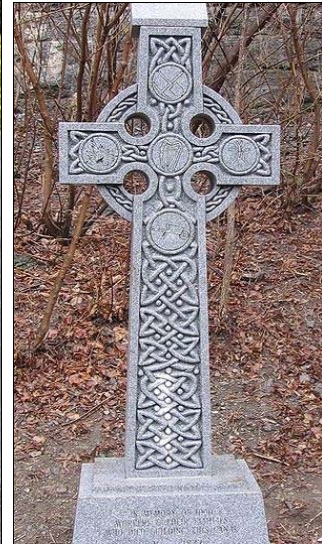
De gauche à droite : monument à Valleyfield, au Québec, en hommage aux travailleurs irlandais tués pendant la grève pour de meilleures conditions de travail durant la construction du canal de Beauharnois ; pont commémoratif des travailleurs du chemin Heron à Ottawa rendant hommage aux travailleurs décédés lorsque le pont s'est effondré ; monument à Ottawa aux travailleurs morts durant la construction du Canal Rideau