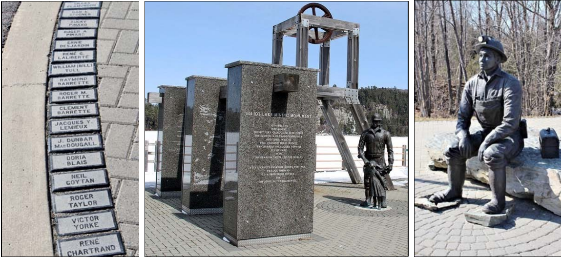
Monument en hommage aux mineurs d'Elliot Lake