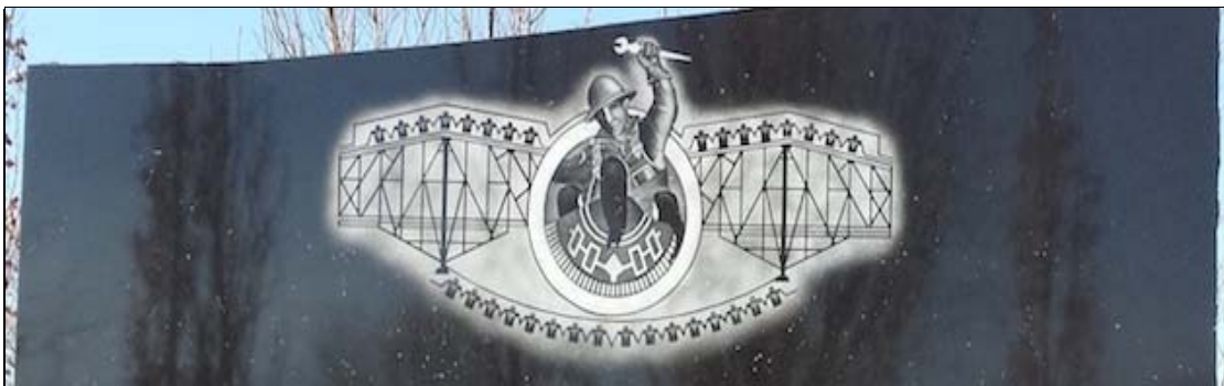
Mémorial à Kahnawà:ke aux travailleurs morts lors de l'effondrement du pont de Québec en 1907