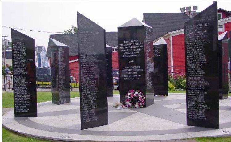
De gauche à droite : Escuminac, au Nouveau-Brunswick, monument aux pêcheurs ; Lunenburg en Nouvelle-Écosse, monument aux pêcheurs disparus en mer