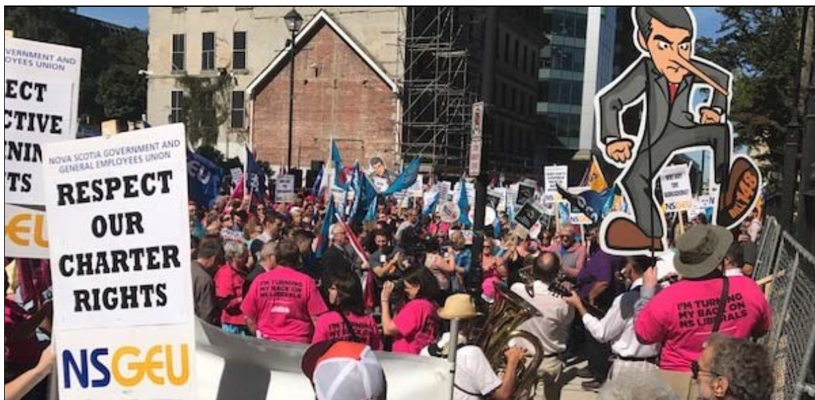
Halifax, le 21 septembre 2017

Ceux qui sont au pouvoir disent que les travailleurs du secteur public ou les programmes sociaux sont un « coût » pour justifier la mise en place d'arrangements pour exclure ceux qui produisent toute l'infrastructure matérielle et sociale des prises de décision et pour empêcher que les besoins du peuple passent en premier.