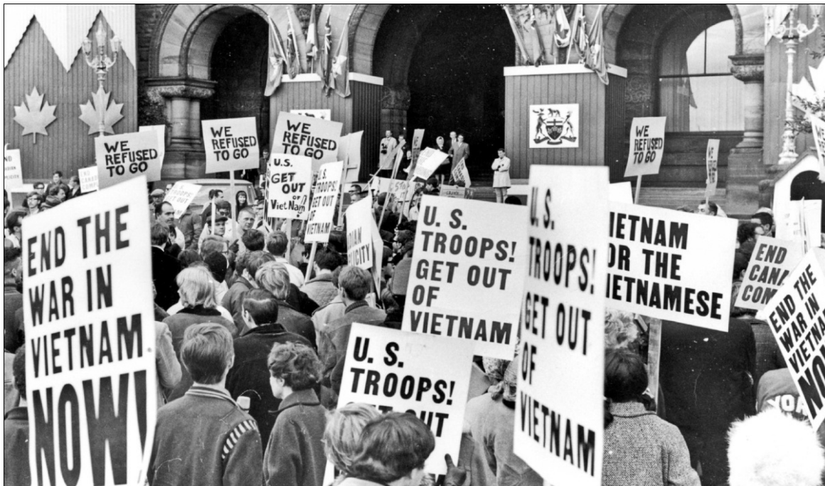
La longue histoire d'amitié entre les peuples canadien et vietnamien inclut l'opposition à la guerre dirigée par les États-Unis contre le Vietnam, dont cette manifestation à Queen's Park à Toronto en 1967.

Des Canadiens de Vancouver et de Toronto, dont plusieurs d'origine vietnamienne, ont fait savoir que des provocations ont lieu qui ont comme objectif de nuire aux relations entre le Canada et le Vietnam. Entre autres, le drapeau du régime réactionnaire de Saïgon, renversé à la fin de la lutte de libération du Vietnam le 30 avril 1975, est présenté au Canada lors de certains événements publics et officiels comme si c'était le drapeau officiel du Vietnam, ce qui n'est pas! [1] Non seulement des gens ordinaires, mal informés, mais aussi des conseillers municipaux et des responsables de divers niveaux, ont arboré ce drapeau ou porté des écharpes arborant ses couleurs. Alors que certains sont clairement des réactionnaires qui s'opposent à la souveraineté du Vietnam et ont l'habitude de provoquer la division dans la communauté au Canada et parmi les Canadiens, d'autres pensent qu'ils célèbrent l'amitié entre le Canada et le Vietnam. Ils ne sont pas très contents quand ils apprennent qu'ils sont utilisés comme des pions pour promouvoir l'inimitié et les divisions.