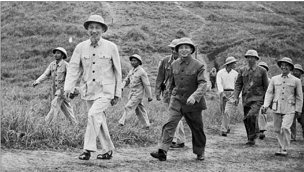
Hô Chi Minh, le dirigeant du peuple vietnamien, photographié ici en 1957, a joué un rôle clé dans la résistance organisée à l'occupation coloniale française, puis aux envahisseurs américains, bien qu'il n'ait pu voir de son vivant la réunification de son pays. À sa droite sur la photo, le célèbre général Vo Nguyen Giap.

Le 30 avril 1975, il y a trente-trois ans, les impérialistes américains ont dû fuir le Vietnam : leur régime fantoche de Saïgon s'effondrait et leurs agression et intervention au Vietnam essuyaient la défaite.