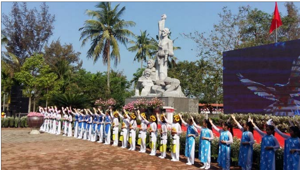
La cérémonie en mémoire des victimes du massacre de My Lai le 16 mars 2018