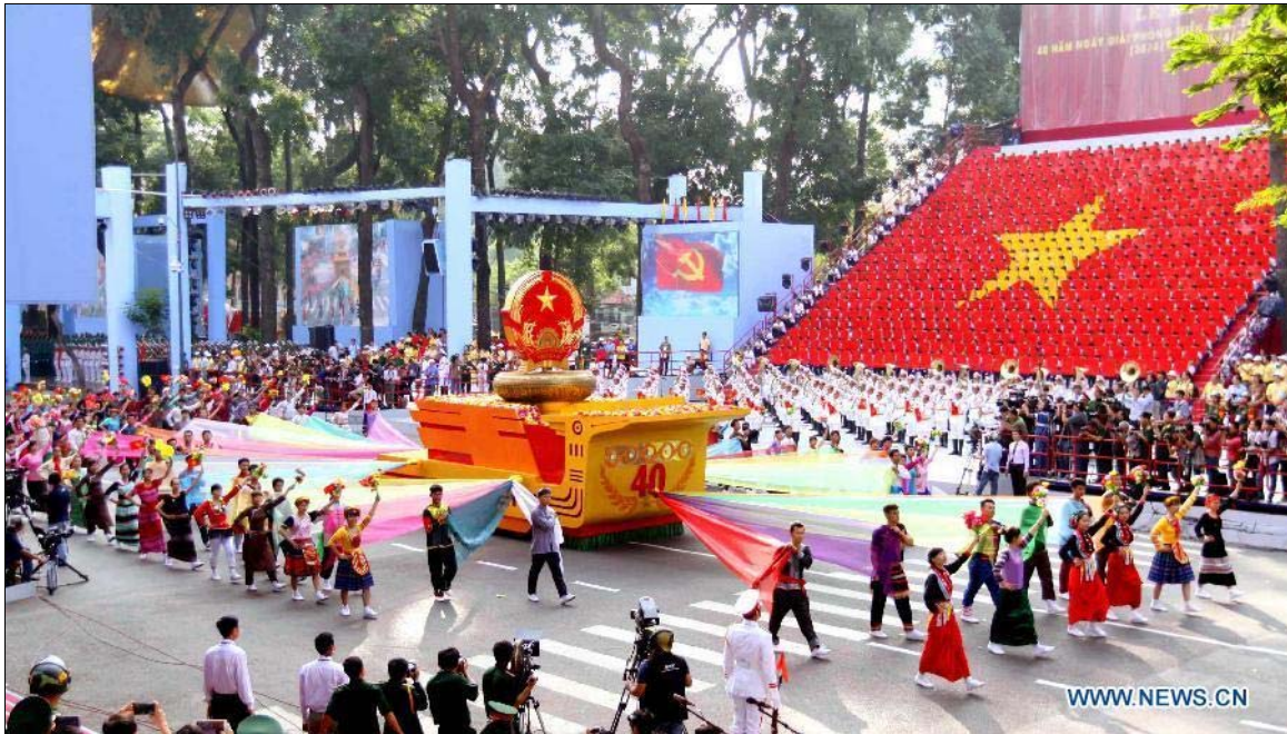
Une cérémonie du 30 avril 2015 à Hô-Chi-Minh-Ville marquant le 40e anniversaire de la réunification nationale du pays

La barbarie de l'intervention et de l'agression perpétrées contre le peuple du Vietnam par l'impérialisme américain a été condamnée par les peuples du monde, y compris aux États-Unis où cela a provoqué un important mouvement de la jeunesse contre la guerre. Le peuple vietnamien a défendu son pays et a vaincu par une démonstration d'héroïsme et de bravoure sans pareil. Les Vietnamiens se sont lancés corps et âme dans la lutte pour la libération nationale, pour la réunification et pour l'indépendance. L'héroïque peuple vietnamien a combattu pour les autres peuples du monde qui étaient aussi sous le feu de l'impérialisme américain et il a remporté la victoire sur le champ de bataille.