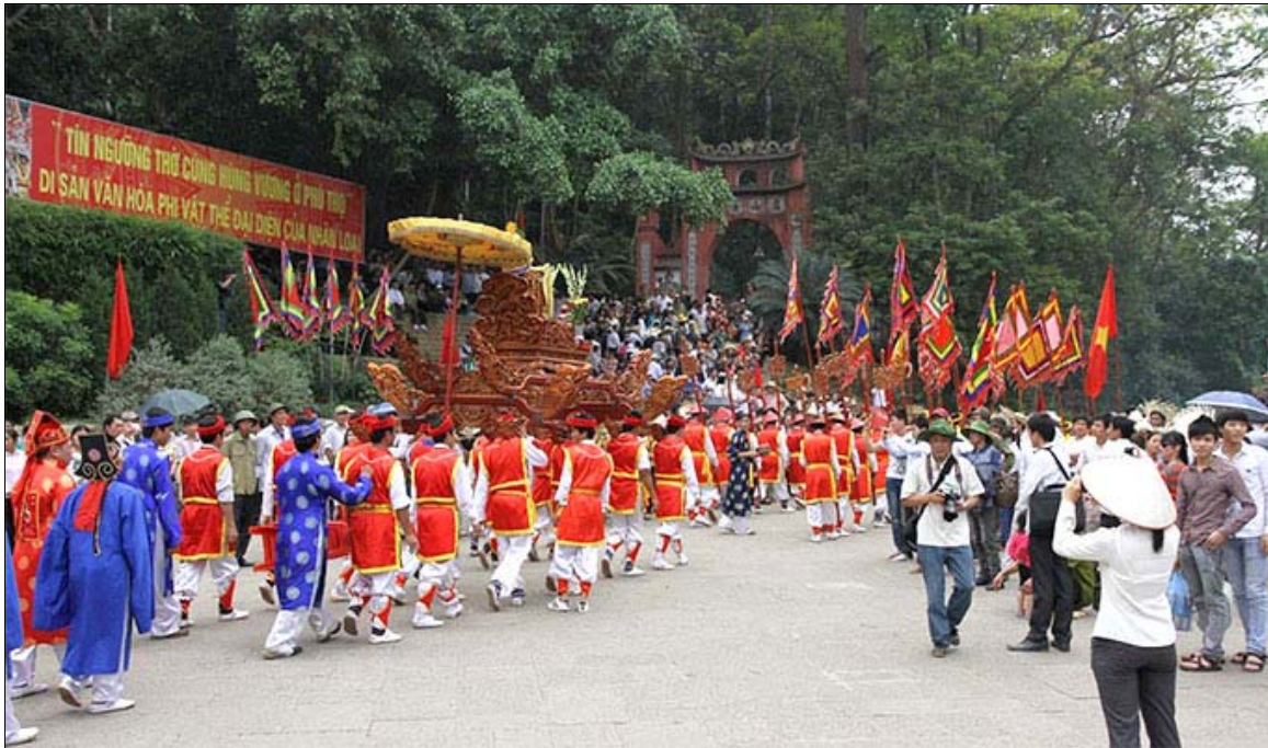
Les préparatifs pour le festival de cette année, le 20 mars 2018

Lors du festival, le hat xoan , entre autres, est mis à l'honneur. Il s'agit de la musique folklorique traditionnelle de la province de Phu Tho présentée pendant les deux premiers mois du calendrier lunaire. En 2017, l'UNESCO a ajouté le hat xoan à la liste représentative du patrimoine culturel intangible de l'humanité.