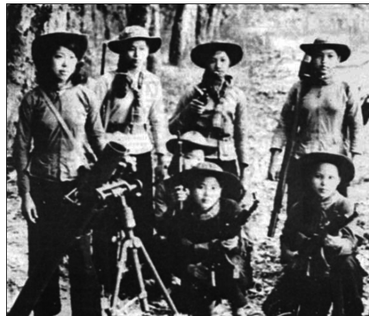
Les combattants héroïques de l'Armée populaire du Vietnam (à gauche) et du Viet Cong, le Front de libération nationale du Vietnam du sud (à droite)

Le Parti communiste du Canada (marxiste-léniniste) salue la victoire de l'héroïque peuple vietnamien de même que ses réalisations et ses succès dans sa lutte depuis la guerre pour la paix, l'indépendance et la prospérité. Nous condamnons l'impérialisme américain et tous les