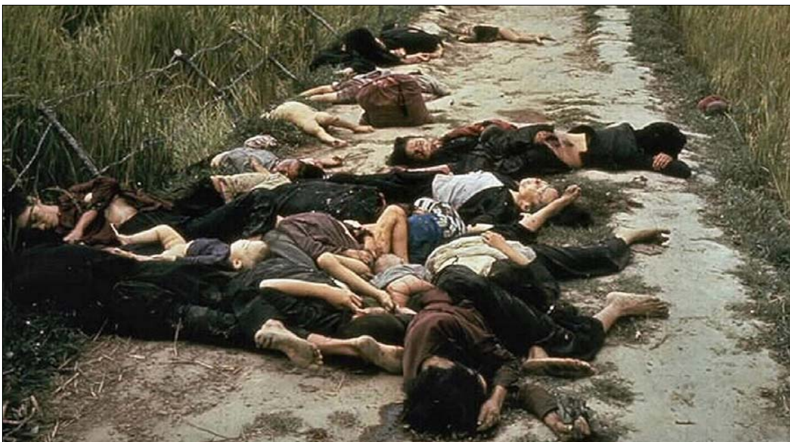
Le massacre de My Lai a été un massacre aveugle de femmes et d'enfants perpétré par l'armée américaine.

Le massacre de My Lai a été perpétré le 16 mars 1968 dans le village de My Lai, commune de Tinh Khe, district de Son Tinh, où des soldats américains, sous les ordres du lieutenant Calley, ont sauvagement tué 504 civils, parmi eux 182 femmes et 173 enfants et nouveau-nés.