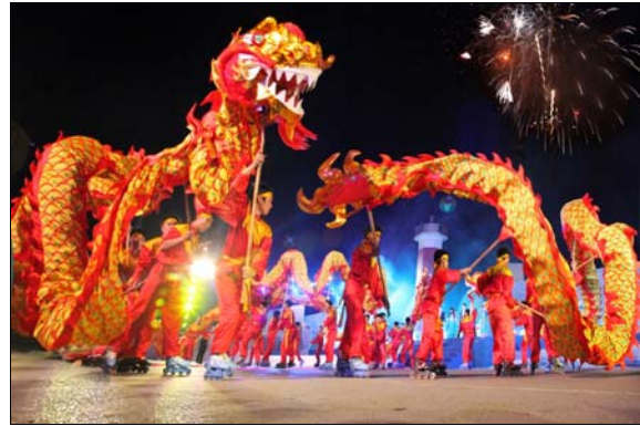
La splendide baie de Halong et une scène du carnaval cette année

Le Carnaval de Halong 2018 a débuté le 28 avril au parc Sun World de Halong dans la ville de Halong dans la province septentrionale de Quang Ninh. Cette année, le thème est « Halong : merveille patrimoniale et destination chaleureuse ». Ce sera une des premières activités qui entameront l'Année du tourisme national 2018 dans la province et elle mettra en vedette de nombreuses représentations de musique, de performances artistiques, de parades de rue et de spectacles pyrotechniques.