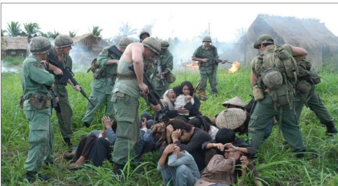
Des soldats de l'armée américaine de la compagnie Charlie rassemblent des femmes, des enfants et des personnes âgées lors du massacre de My Lai.

Le Vietnam a commémoré les victimes du massacre le 16 mars lors de cérémonies auxquelles ont participé des centaines de personnes et de cadres. Plusieurs anciens combattants américains de la guerre du Vietnam étaient également présents et ont exprimé des remords et demandé pardon au peuple vietnamien.