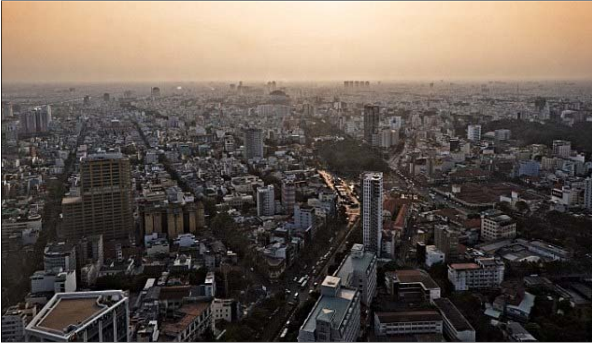
La métropole moderne Hô-Chi-Minh-Ville

Un des faits saillants du Vietnam moderne depuis la libération du pays et que les Vietnamiens ont pris en main leur destin est son développement économique. De grands efforts ont été déployés pour rénover et développer l'économie du pays et améliorer le bien-être de la population.