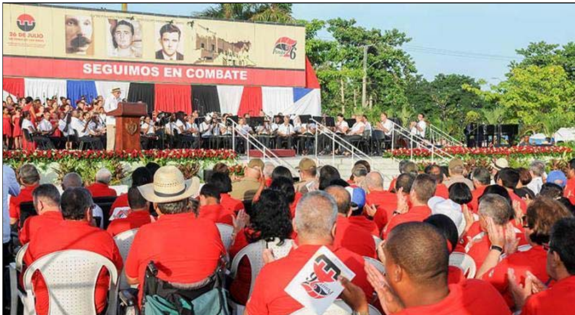
Les festivités centrales de la Journée de Moncada 2017 à Pinar del Río. La bannière rend hommage aux héros de la révolution : « Nous vous suivons dans la bataille. »