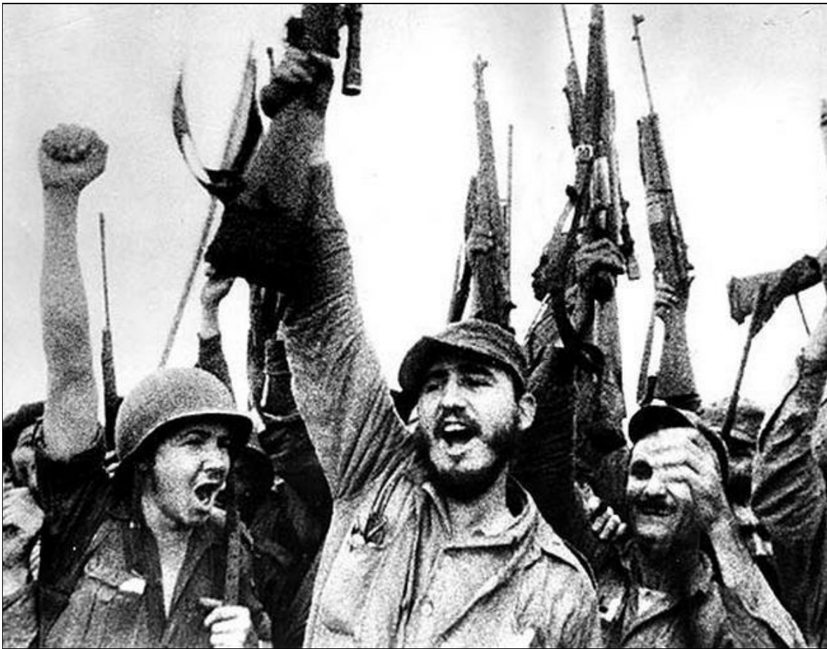
Raúl et Fidel dans la Sierra Maestra durant la guerre révolutionnaire cubaine

Bien que l'assaut de Moncada ait échoué dans son objectif immédiat, il a été déterminant dans la lutte du peuple cubain pour l'affirmation nationale et l'émancipation sociale. Les Cubains ont toujours placé Moncada dans un contexte historique large, le considérant comme une date charnière des aspirations centenaires de Cuba à se défaire de la domination coloniale espagnole et de la tutelle des États-Unis pour établir une indépendance véritable. C'est au cours de son procès que Fidel Castro a livré un discours devenu le manifeste du mouvement pour le renversement de la tyrannie de Batista. Ce discours, portant le titre Historia Me Absolvera (L'histoire m'acquittera) à sa parution, traçait les objectifs nationaux et sociaux du mouvement révolutionnaire qui a fini par triompher le 1er janvier 1959. Aujourd'hui, les casernes Moncada et Carlos Manuel de Céspedes ont été transformées en une école et un musée, des symboles concrets de cette lutte victorieuse.