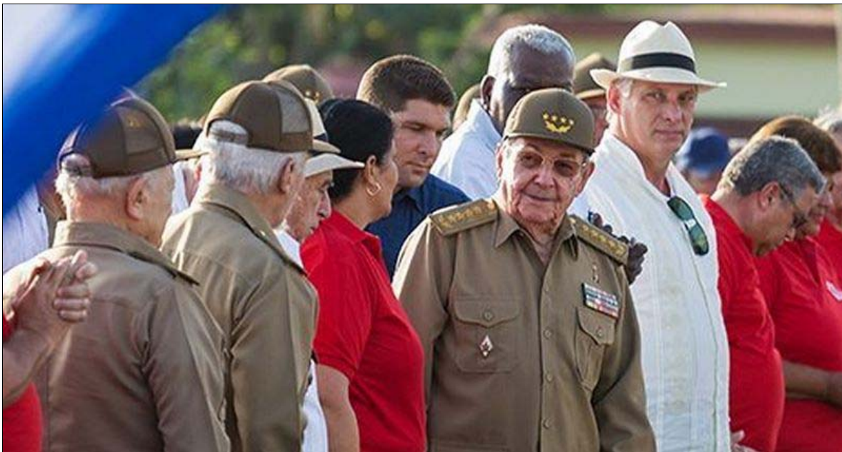
Le président cubain Raúl Castro aux célébrations de la Moncada à 2017 à Pinar del Río. À sa gauche le vice-président Miguel Díaz-Canel Bermúdez.

Ont participé à l'événement les principaux dirigeants de la Révolution cubaine de même que des invités nationaux et étrangers, des attaquants des casernes de Moncada et Carlos Manuel de Cespedes, des membres de l'expédition du yacht Granma et des combattants de la lutte clandestine.