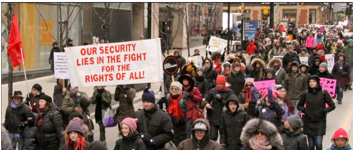
Marche de la Journée internationale de la femme à Toronto le 11 mars 2017

Par des actions de masse militantes au Canada et partout dans le monde pour souligner la Journée internationale de la femme, les femmes ont affirmé leur détermination à renouveler leur résistance et à dresser la bannière des droits des femmes, lui donnant la place qui lui revient dans la société. Par leurs actions, elles ont affirmé que leur rôle dans une société moderne ne peut être qu'un rôle dirigeant par lequel elles refusent d'être prises pour cibles d'attaques et réclament au contraire tout