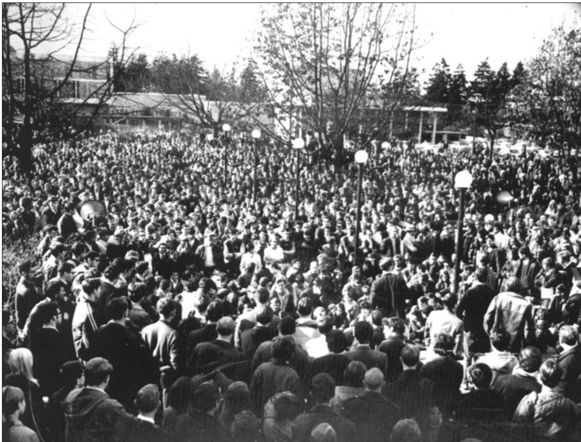
Des milliers d'étudiants de l'Université de la Colombie-Britannique manifestent contre les gestes américains durant la crise des missiles à Cuba le 24 octobre 1962.

54e anniversaire de la fondation des Internationalistes