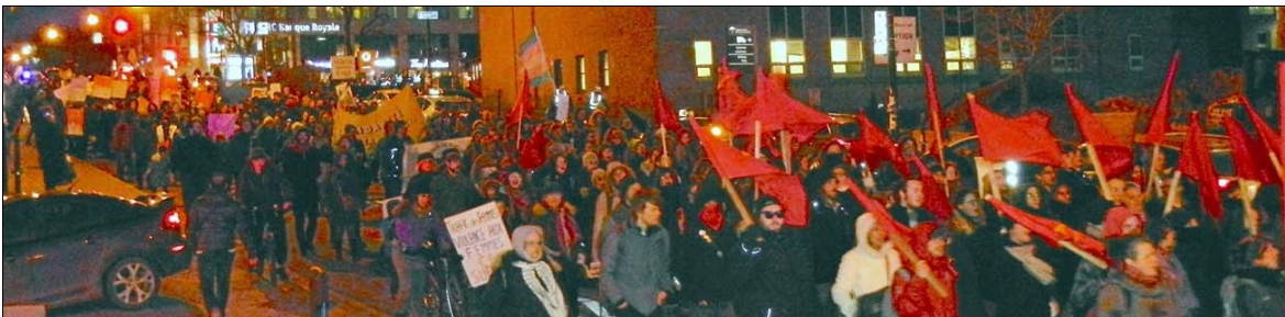
Montréal, 7 mars