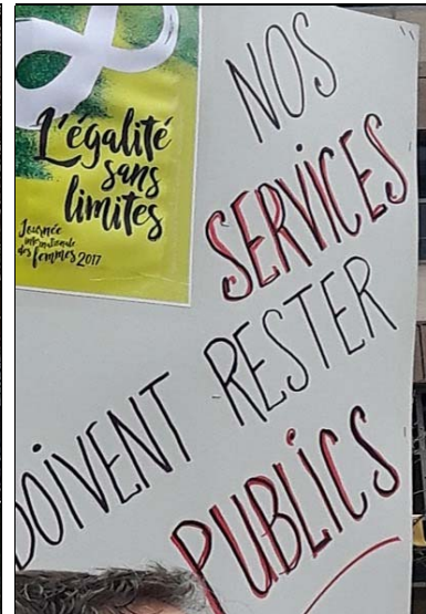
Ottawa, 8 mars