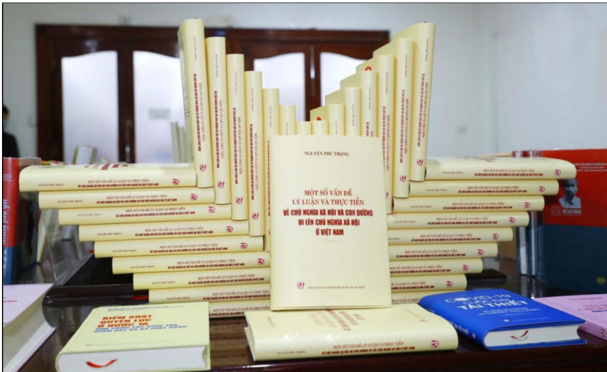
Le livre du secrétaire général du Parti Nguyen Phu Trong intitulé « Quelques questions théoriques et pratiques sur le socialisme et la voie vers le socialisme au Vietnam ».

bien-être social, et non par des interventions non marchandes dans le fonctionnement de l'économie. Ce point de vue a été pleinement affirmé par notre Parti à l'époque où Nguyen Phu Trong était secrétaire général. Actuellement, 72 pays, dont tous les pays de l'ASEAN et les grandes économies de marché telles que le Japon, le Royaume-Uni, le Canada, et l'Australie, ont reconnu que notre pays avait une économie de marché.