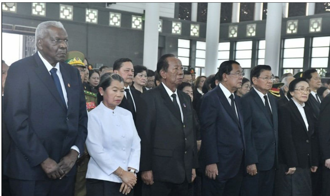
Des délégations internationales participent au service commémoratif, 26 juillet 2024.

À la cérémonie d'inhumation, les dirigeants et anciens dirigeants du Parti, de l'État et du Front de la Patrie du Vietnam, les camarades, le public, les amis internationaux et la famille ont déposé des fleurs et rendu un hommage silencieux avant que le camarade Nguyen Phu Trong ne soit inhumé.