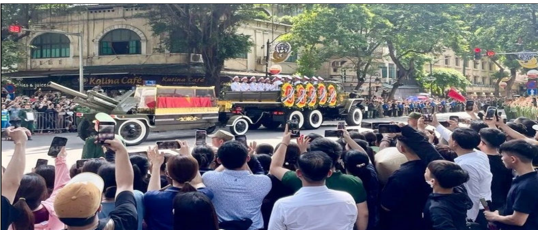
Des dizaines de milliers de personnes font la queue dans les rues pour la procession funéraire à Hanoï, le 26 juillet 2024, pour faire leurs adieux.