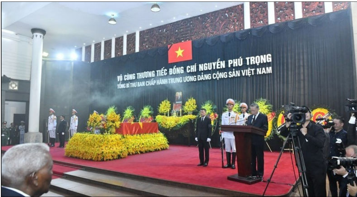
Le président To Lam prononce l'éloge funèbre lors du service commémoratif, 26 juillet 2024.

Le camarade Nguyen Phu Trong a été inhumé avec tous les honneurs au cimetière de Mai Dich à Hanoï le 26 juillet. Les cérémonies de commémoration et d'inhumation au hall des obsèques nationales de Hanoï et l'enterrement ont eu lieu en présence du président To Lam, du premier ministre Pham Minh Chinh, du président de l'Assemblée nationale Tran Thanh Man et d'autres membres de haut rang du Parti communiste du Vietnam, de représentants de l'armée, d'organisations religieuses et de ministères, ainsi que de membres du corps diplomatique étranger et d'amis de la communauté internationale.