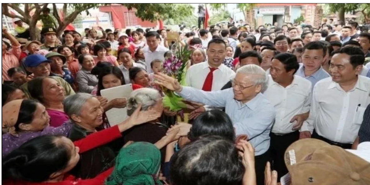
Le secrétaire général Nguyen Phu Trong se joint aux habitants du village de Thuong Dien, de la commune de Vinh Quang, du district de Vinh Bao, lors de la Grande journée de l'unité nationale de la ville de Hai Phong, le 15 novembre 2017.

Nguyen Phu Trong a accordé une grande attention au développement culturel. Il a notamment présidé la Conférence nationale culturelle tenue le 24 novembre 2021. Il s'agissait d'une conférence d'importance historique, car il y a 75 ans, le président Hô Chi Minh avait présidé la première Conférence culturelle nationale tenue le 24 novembre 1946. Cette conférence a fait le point sur le processus de développement culturel après près de 40 ans de Renouveau et a ouvert un tournant dans la revalorisation et le développement de la culture, répondant aux exigences globales de développement du pays dans la nouvelle situation et portant la marque du secrétaire général Nguyen Phu Trong.