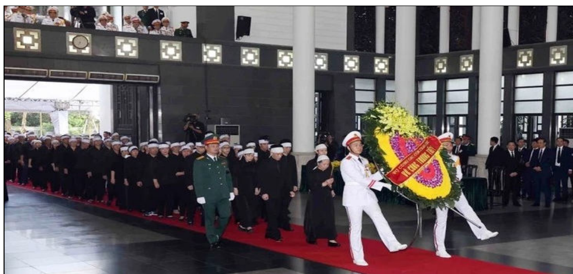
L'épouse, les enfants, les petits-enfants, les arrière-petits-enfants et d'autres membres de la famille du camarade Trong se préparent à lui rendre hommage.