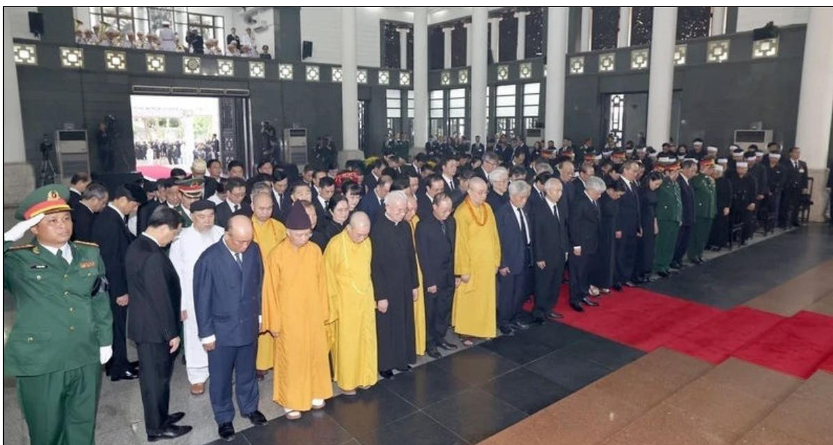
La délégation du Comité central du Front de la Patrie du Vietnam présente ses hommages.