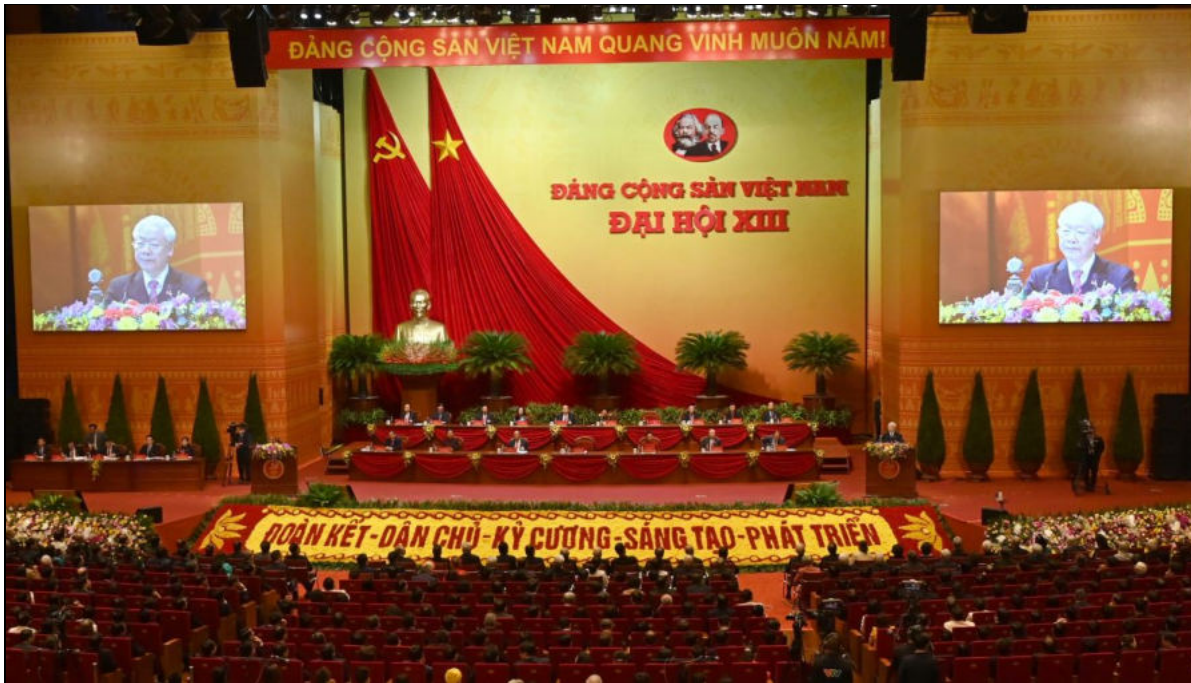
Le secrétaire général Nguyen Phu Trong fait une intervention lors du XIIIe Congrès du Parti, qui s'est déroulé du 25 janvier au 1er février 2021.

poursuite de la ligne de renouveau, d'indépendance et d'autonomie du Parti. Avec l'ensemble du Parti, il a dirigé le pays à travers de nombreuses difficultés et défis et a remporté des succès spectaculaires dans tous les domaines.