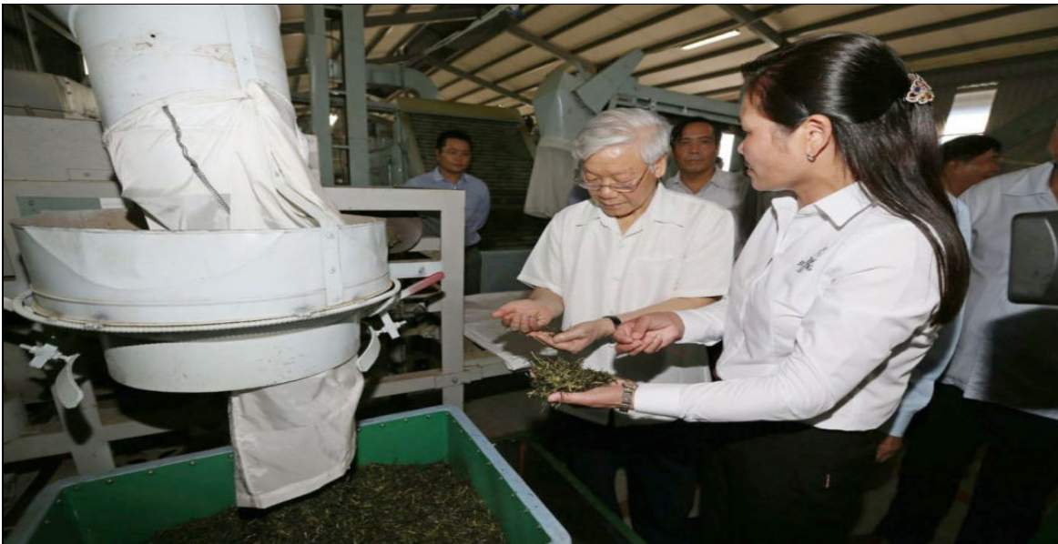
Le secrétaire général Nguyen Phu Trong a visité l'usine de thé Sen Cha de la Tam Duong Tea Development and Investment Joint Stock Company dans la commune de Ban Bo, district de Tam Duong, province de Lai Chau.

Selon la Banque mondiale, les soins de santé universels au Vietnam ont progressé à mesure que le niveau de vie s'améliorait. L'indice de couverture sanitaire universelle est de 73 (sur 100), supérieur à la moyenne régionale et à la moyenne mondiale. Le nombre moyen d'années de scolarisation au Vietnam est de 10,2 ans, soit au deuxième rang de la région, derrière Singapour. L'indice du capital humain du Vietnam est de 0,69 (l'échelle la plus élevée est 1), soit au premier rang parmi les économies ayant le même niveau de revenu. L'accès des populations aux infrastructures a été considérablement amélioré. En 2019, 99,4 % de la population se sert de l'électricité pour s'éclairer, contre 14 % en 1993.