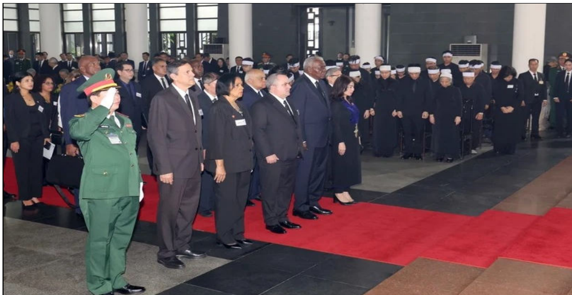
La délégation cubaine, conduite par le président de l'Assemblée nationale du pouvoir populaire de Cuba, Esteban Lazo Hernandez, présente ses hommages.