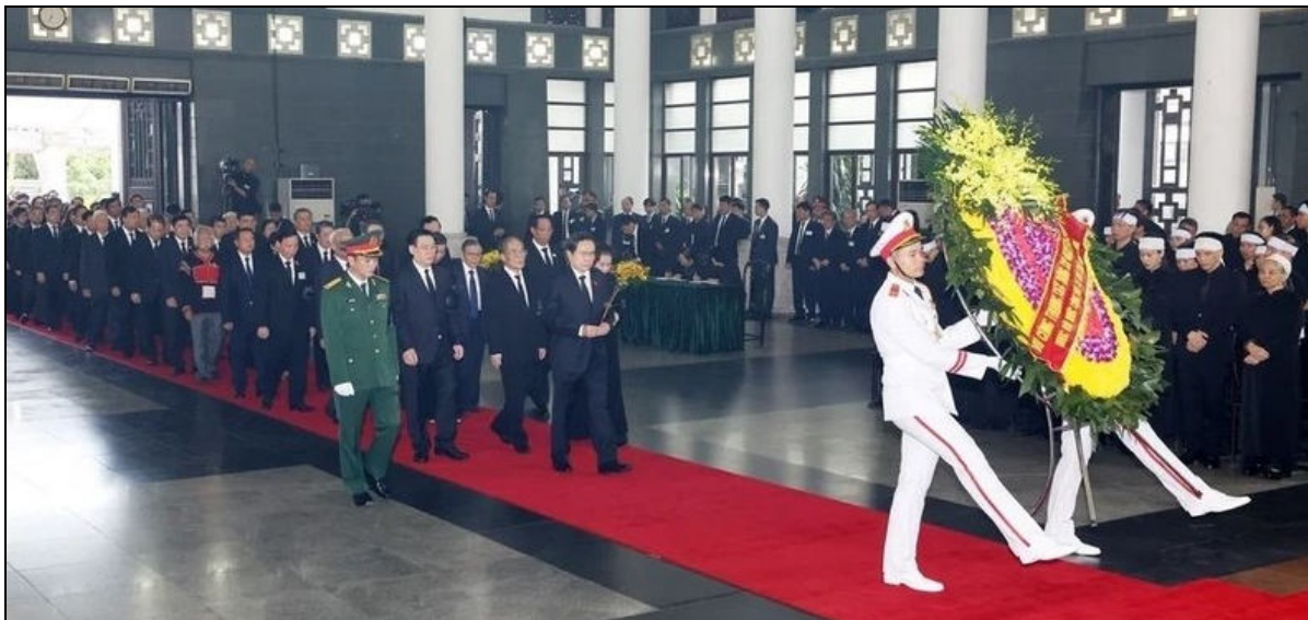
La délégation de l'Assemblée nationale, dirigée par le membre du Bureau politique et président de l'Assemblée nationale Tran Thanh Man, lui rend hommage.