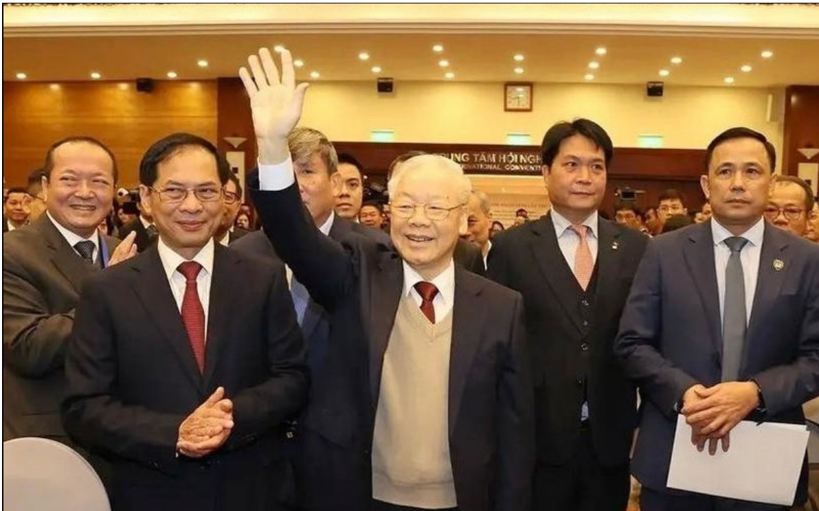
Le secrétaire général du Parti Nguyen Phu Trong (au centre) assiste à la 32e conférence nationale sur les affaires étrangères.

Avec près de 60 ans d'expérience dans la pratique révolutionnaire, avec une vision stratégique, scientifique et dialectique et une perspicacité politique aiguisée, liant toujours étroitement la théorie aux résumés pratiques, et appliquant et développant de manière créative le marxisme-léninisme et la pensée de Hô Chi Minh, le camarade Nguyen Phu Trong a apporté des contributions cruciales et remarquables à l'édification et au perfectionnement de la théorie et de la plateforme du Parti sur le développement du pays orienté vers le socialisme, les lignes directrices et les politiques du Parti et de l'État dans de nombreux domaines, de la politique, de l'économie, de la société, de la défense, de la sécurité aux affaires étrangères, a écrit Bui Thanh Son.