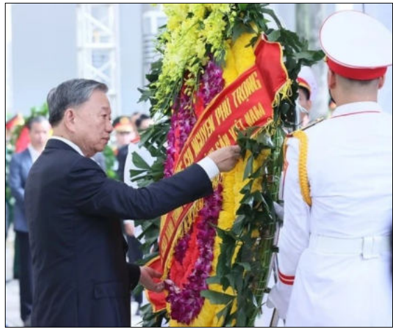
La délégation du Comité central du Parti communiste du Vietnam, dirigée par le membre du Bureau politique et président To Lam, lui rend hommage, 25 juillet 2024.