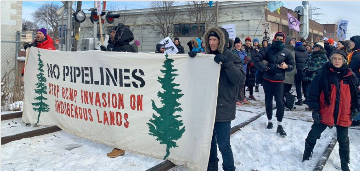
Barrage ferroviaire à Toronto en soutien aux défenseurs de la terre wet'suwet'en, 9 février 2020. Ces barrages ont été présentés comme des menaces à l'« ordre » ou à la « sécurité ».

menace ces intérêts doit être supprimé. Les menaces à l'« ordre » ou à la « sécurité » comprennent la perturbation des corridors commerciaux, des voies de transport, des corridors énergétiques, des chaînes d'approvisionnement, qui sont tous rapidement transformés pour répondre aux besoins de la machine de guerre de l'impérialisme américain. Les raisons de ces perturbations ne sont pas du tout analysées, alors que tout est fait pour justifier la criminalisation des citoyens et résidents et les réclamations qu'ils ont en droit de faire à la société.