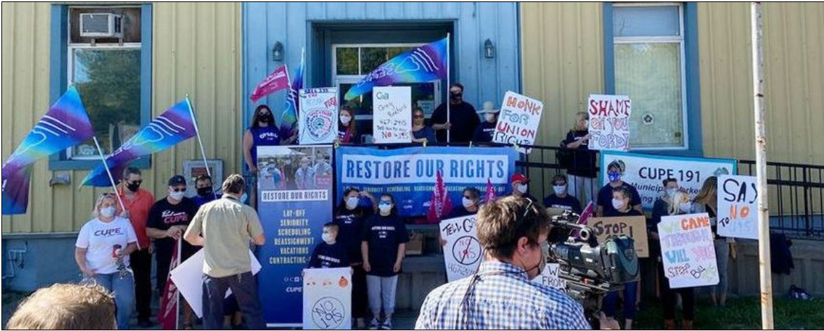
Les travailleurs de la santé manifestent contre les atteintes à leurs droits et conditions de travail lors de la pandémie de la COVID-19, à Kenora, 27 août 2020

Après la décision de la Cour fédérale jugeant inconstitutionnelle l'utilisation de la Loi sur les mesures d'urgence, l'ACLCL a publié un communiqué de presse intitulé : « La notion d'urgence doit être universelle : La Cour fédérale donne gain de cause à l'ACLCL dans la contestation de la Loi sur les mesures d'urgence ».