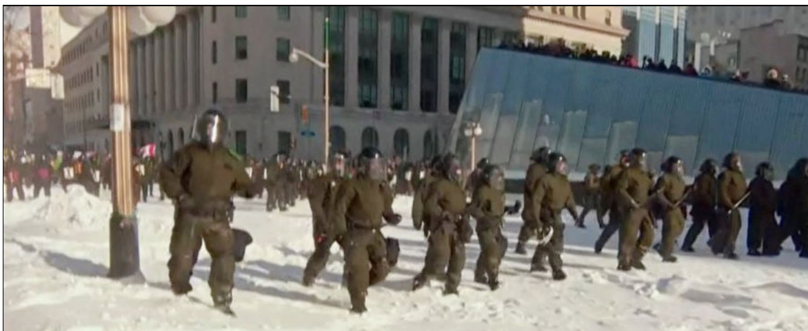
La police d'Ottawa disperse la manifestation du Convoi pour la liberté en vertu de la Loi sur les mesures d'urgence , 19 février 2022.

Le 23 janvier, la Cour fédérale du Canada a jugé que l'invocation de la Loi sur les mesures d'urgence par le gouvernement Trudeau le 14 février 2022, en réponse au « Convoi de la liberté », violait la Charte des droits et libertés et était donc inconstitutionnelle. Cette décision fait référence à la série de manifestations et de blocages qui ont eu lieu à différents endroits au Canada pour protester contre les obligations et les restrictions liées au vaccin COVID-19, qui ont commencé au début de l'année 2022, pendant la pandémie de la COVID.