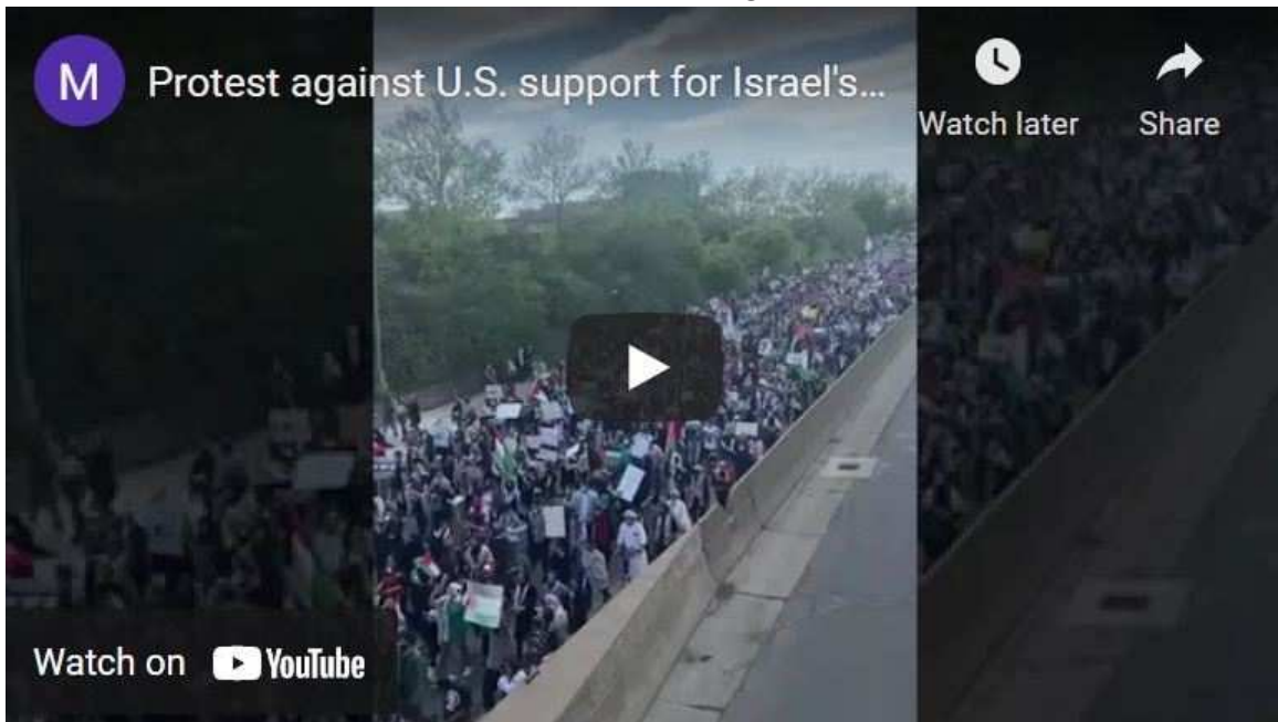
Manifestation contre le soutien des États-Unis aux crimes d'Israël lors du passage du président Joe Biden le 18 mai 2021