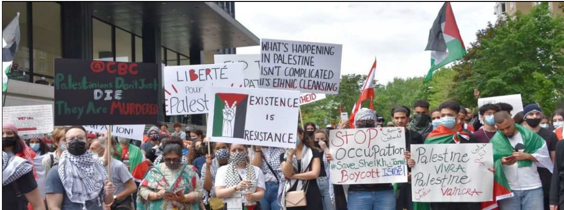
Les résidents de Montréal ont de nouveau pris d'assaut les rues pour appuyer la résistance du peuple palestinien, le 22 mai 2021.

C'est par milliers, le samedi 15 mai, que les Montréalais ont fait un avec le peuple palestinien pour dire : « Libérez la Palestine ! », « La résistance est un droit ! », « Vive la lutte du peuple palestinien ! », « Fin à l'occupation ! » et « L'occupation est un crime ! » et pour dénoncer le silence inadmissible du Canada sur le génocide de l'État d'Israël contre le peuple palestinien.