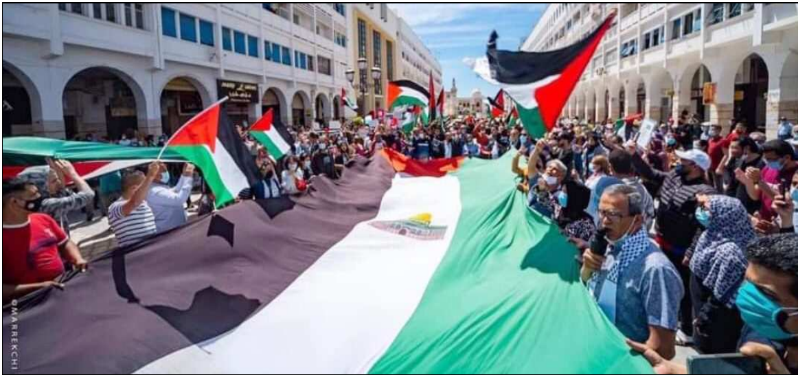
Afrique du Sud