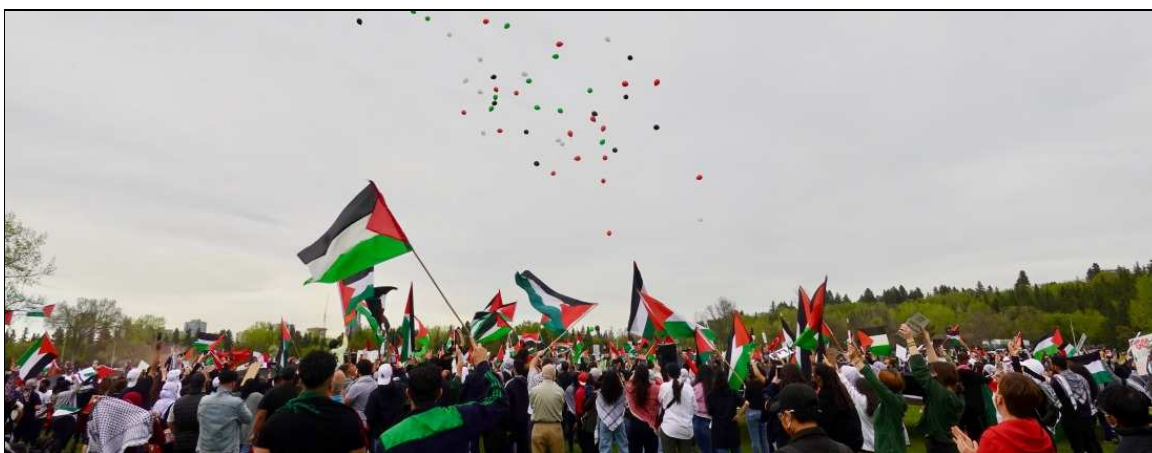
Rassemblement de solidarité avec le peuple palestinien, 23 mai 2021

Le 18 mai, Edmonton a répondu à l'appel à une journée d'action en solidarité avec le soulèvement et la grève générale en Palestine.