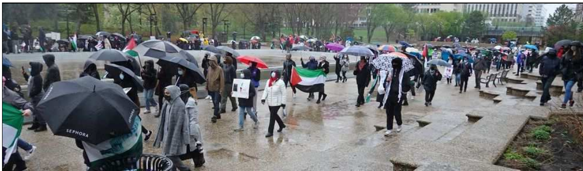
La manifestaton de solidarité du 18 mai 2021

Le 15 mai, environ 1 000 voitures avaient participé à une caravane qui a circulé sur le périphérique Anthony Henday puis parcouru la ville du nord au sud avant de revenir à son point de départ, au son des klaxons et agitant des drapeaux et foulards palestiniens. Les voitures étaient décorées de drapeaux, d'affiches exprimant le soutien à la Résistance palestinienne, la conviction que la Palestine sera libre, du fleuve à la mer, et la détermination à libérer, libérer la Palestine !