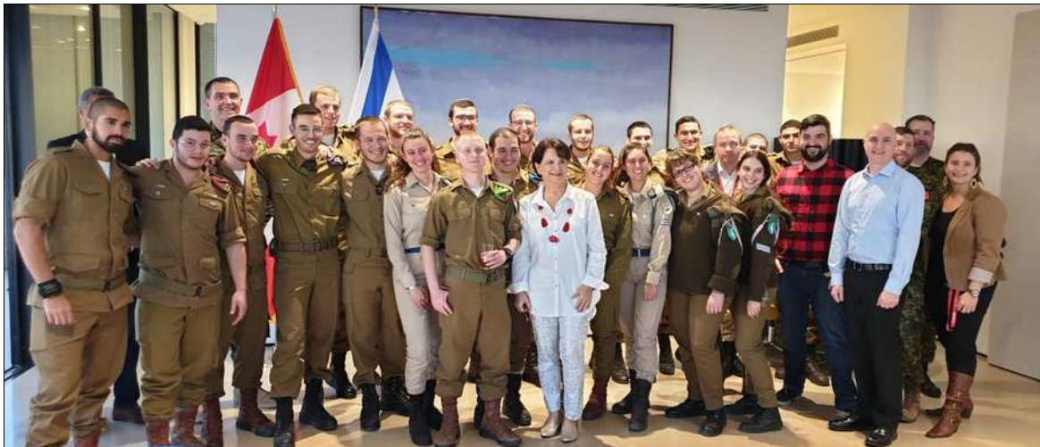
L'ambassadrice du Canada en Israël, Deborah Lyons, donne une réception à l'ambassade du Canada à Tel Aviv pour honorer les Canadiens qui servent dans l'armée israélienne, le 16 janvier 2020.

Loin d'exiger d'Israël qu'il rende des comptes pour ses violations du droit international et des nombreuses résolutions de l'ONU, y compris la résolution qui a créé l'État d'Israël, les États-Unis et le Canada sont ses principaux complices. Le rôle des États-Unis est bien connu, mais celui du Canada l'est moins. En plus de vendre des armes à Israël, les gouvernements canadiens successifs ont permis à l'Armée de défense d'Israël de recruter ouvertement des jeunes Canadiens au Canada alors que la loi canadienne considère comme une infraction le fait de recruter ou d'inciter quiconque à s'engager dans l'armée d'un pays étranger. Mais ce n'est pas tout. En janvier 2020, l'ambassadeur du Canada en Israël a en fait donné une réception à l'ambassade à Tel Aviv pour les Canadiens servant dans l'armée israélienne, disant que l'ambassade était très fière de ce qu'ils faisaient et voulait continuer à les soutenir.