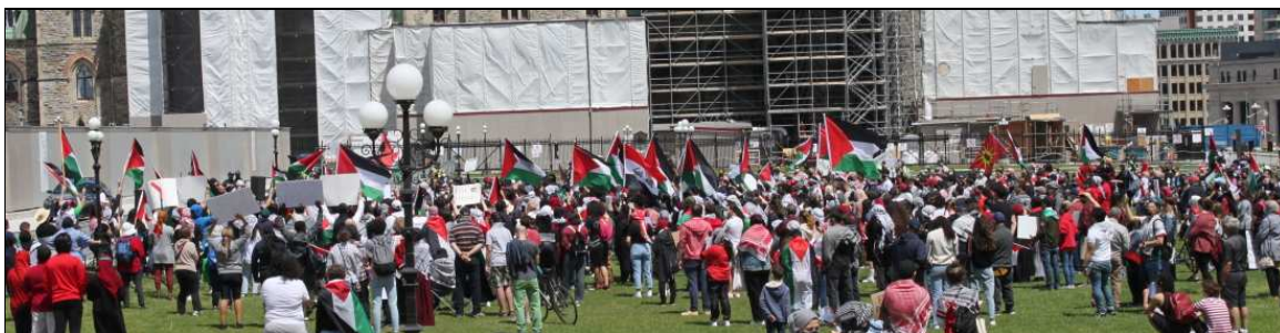
Les résidents d'Ottawa se rassemblent de nouveau sur la colline parlementaire en solidarité avec la résistance palestinienne héroïque, le 23 mai 2021